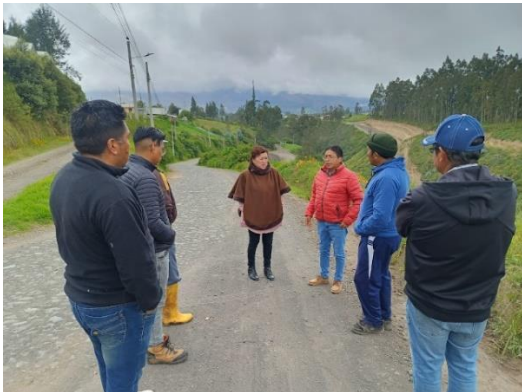
Fiscalización Guallaro Chico Casa barrial, estudio topográfico, ampliación de la vía