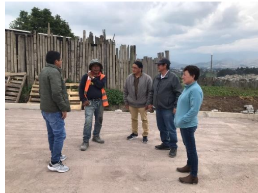
Fiscalización adoquinada, calle Anibal Guañuna