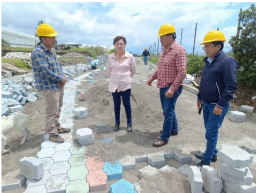
Fiscalización adoquinado calle Mojanda