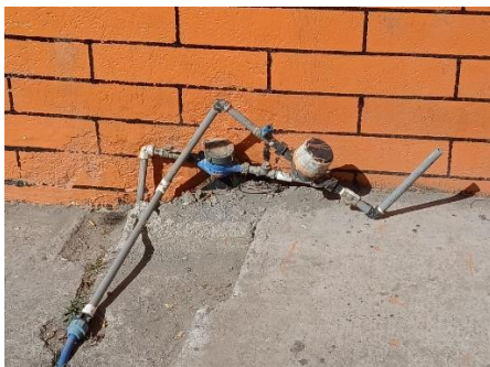
Inspección red de agua Malchinguí