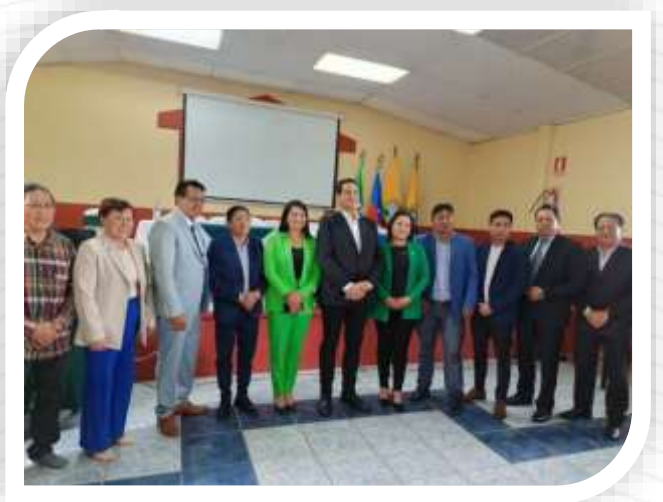
SESIÓN SOLEMNE PARROQUIALIZACIÓN TUPIGACHI