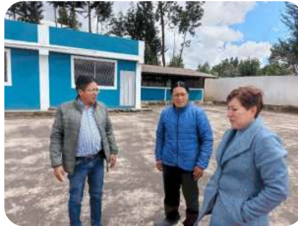
FISCALIZACIÓN ESTADIO SAN JOSE GRANDE