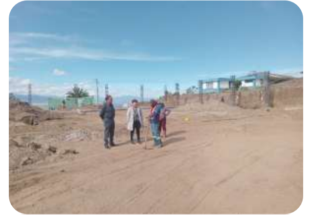
FISCALIZACIÓN CONSTRUCCIÓN DEL COLISEO DE TOCACHI.