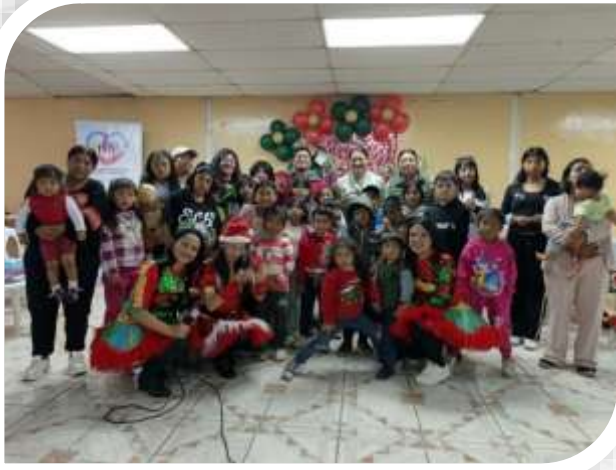
AGASAJO NAVIDEÑO PROYECTO DE APOYO Y CUSTODIA FAMILIAR