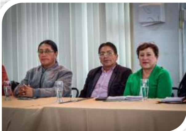
TALLER MANEJO DE CRICIS ASOCIACIÓN DE MUNICIPALIDADES ECUATORIANAS