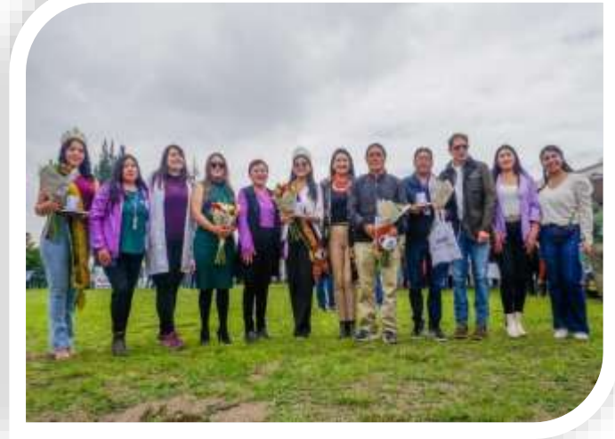
DÍA INTERNACIONAL DE LA ELIMINACIÓN DE LA VIOLENCIA CONTRA LA MUJER