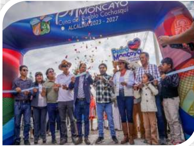
INAUGURACIÓN DEL ADOQUINADO BARRIO PRIMERO DE OCTUBRE