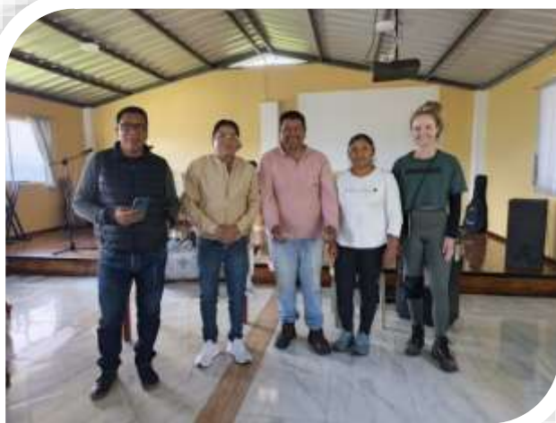
ENTREGA DE VIVERES FUNDACION COAGRO