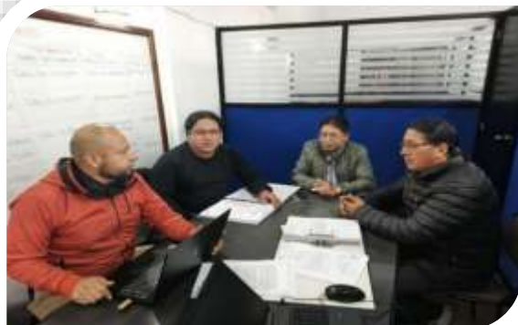
MESA TECNICA PRESUPUESTO 2026- COMISION DE FINANZAS, FISCALIZACION AVALUOS Y CATASTROS