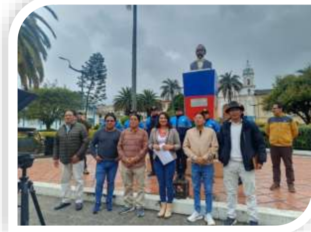
REGISTRO AUDIOVISUAL SOBRE LA SITUACIÓN DE SEGURIDAD EN EL CANTÓN.