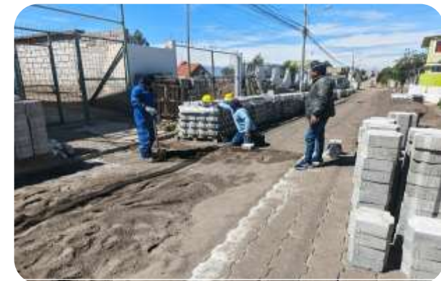
FISCALIZACIÓN AVANCE ADOQUINADO CHIMBACALLE