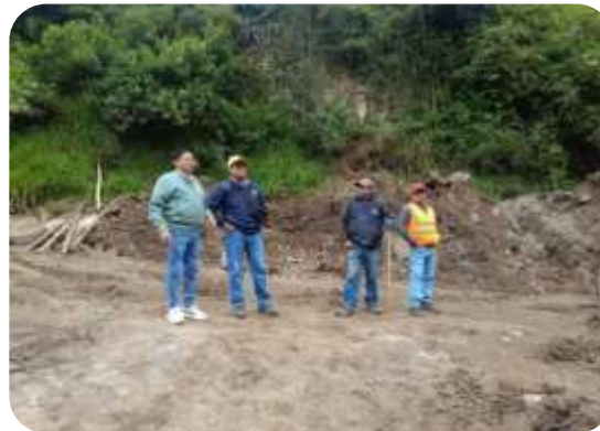
FISCALIZACIÓN TRAMO SAN LUIS DE ICHISI Y ANGUMBA