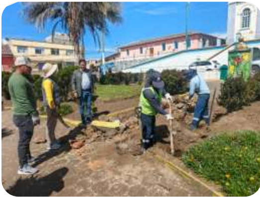
FISCALIZACIÓN AVANCE ADECENTAMIENTO PARQUE LA ESPERANZA