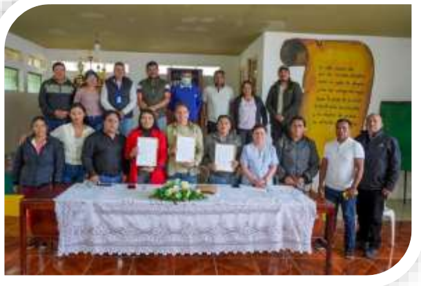
CONVENIO DE COGESTIÓN ENTRE EL GAD PEDRO MONCAYO Y LA EMPRESA FLORSANI S.A.S.