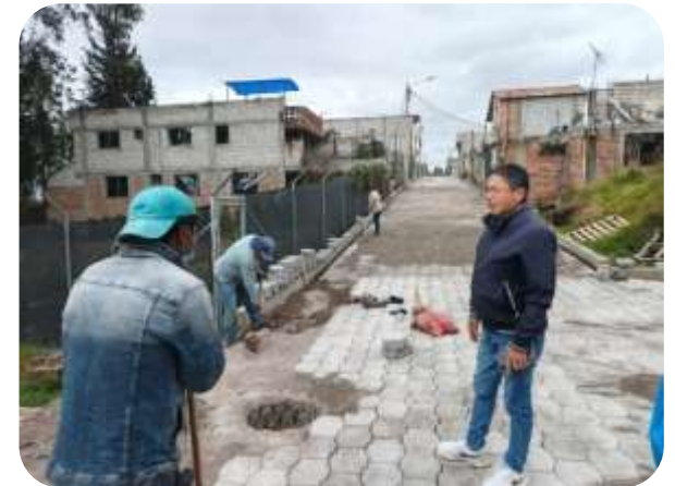
FISCALIZACION ADOQUINADO BARRIO PRIMERO DE OCTUBRE