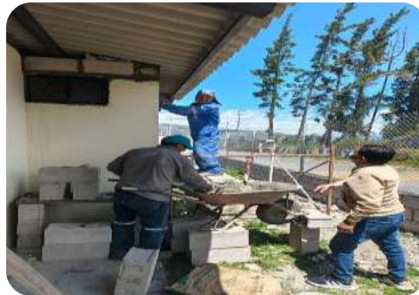
FISCALIZACION CONTRUCCION CASA DEL ADULTO MAYOR PURUHANTAG