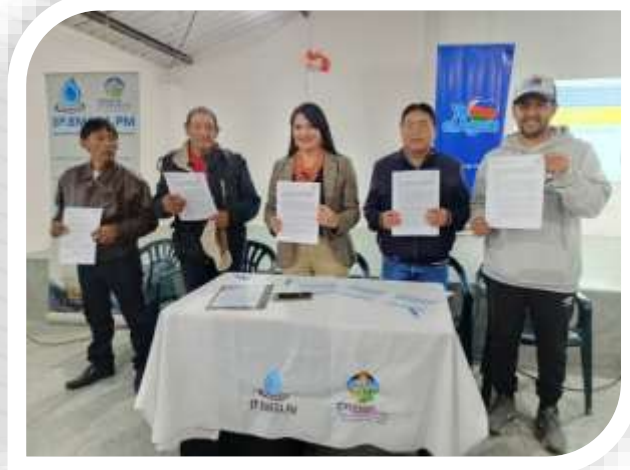
CONVENIO CON LA EMPRESA PÚBLICA EMASA