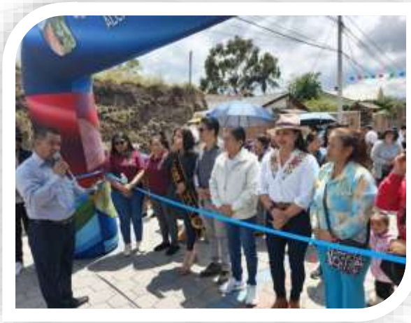
INAUGURACION DEL ADOQUINADO VIA MARCO REINOSO