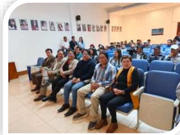
ENTREGA DE EQUIPOS A LOS TRABAJADORES DEL SINDICATO