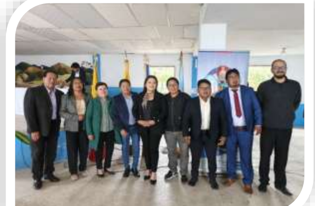
SESION SOLEMNE 447 AÑOS PARROQUIA DE TOCACHI