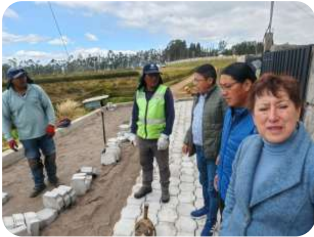
FISCALIZACIÓN PRIMERO DE OCTUBRE