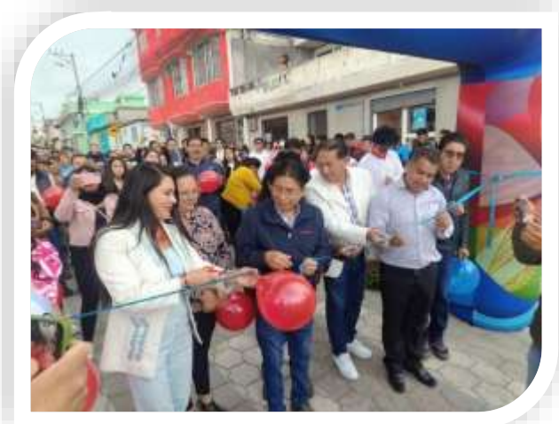
INAUGURACIÓN BARRIO 18 DE SEPTIEMBRE