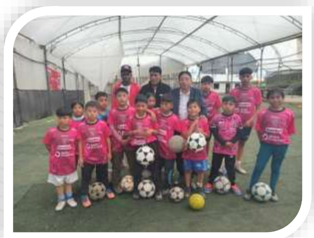
ENTREGA DE BALONES CANCHAS EL MONO