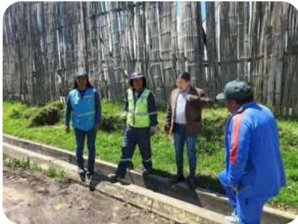
FISCALIZACIÓN ARREGLO VÍAL COMUNIDAD CANANVALLE