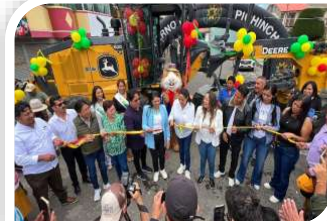
INAUGURACION MAQUINARIA PARA MALCHINGUI