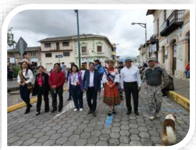
CALEBRACIÓN DEL ARUCHICO ESCOLAR