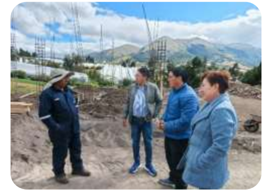
FISCALIZACIÓN ESTADIO LOMA GORDA LAURITA