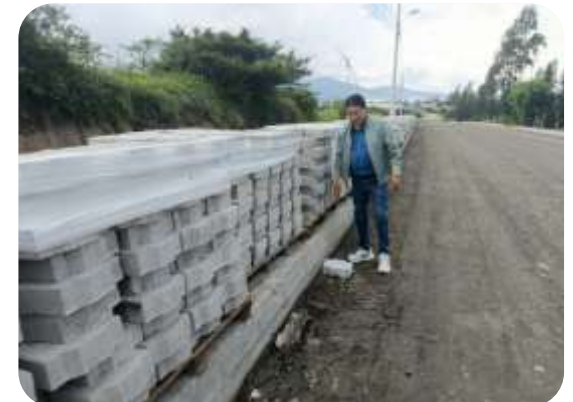
FISCALIZACIÓN ADOQUIN GUALLARO GRANDE