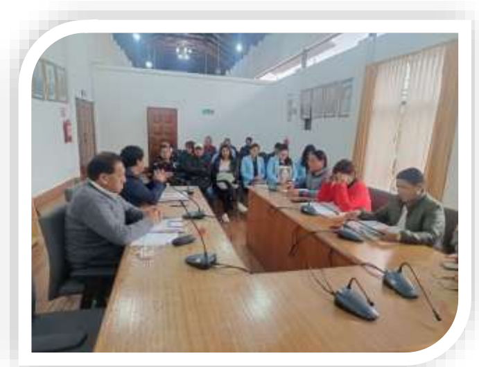
Tabla 8. Sesiones