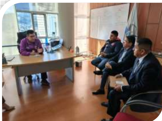
REUNION CON EL INTENDENTE DE LA POLICIA PARA LOS PERMISOS DE LAS FIESTAS TAURINAS