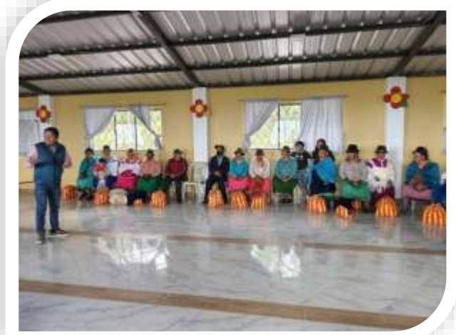
AGASAJO NAVIDEÑO ADULTOS MAYORES FUNDACION COAGRO