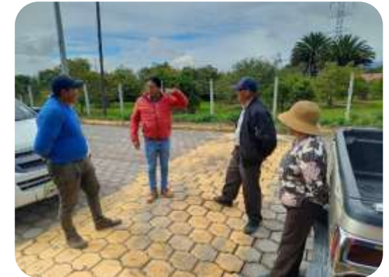
FISCALIZACION GUALLARO GRANDE BORDILLOS