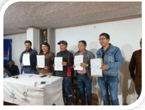
FIRMA DE CONVENIO EN LA COMUNIDAD DE CAJAS CON EP EMASA PM