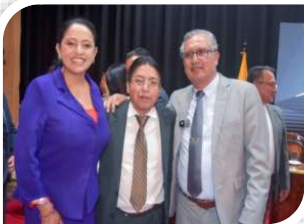
SESION SOLEMNE CANTON MEJIA