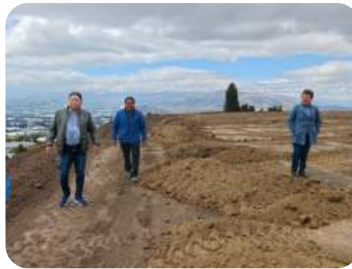
FISCALIZACIÓN ESTADIO SAN JOSE ALTO