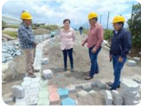
FISCALIZACIÓN ALCANTARILLADO COMBINADO CALLE SAN ISIDRO