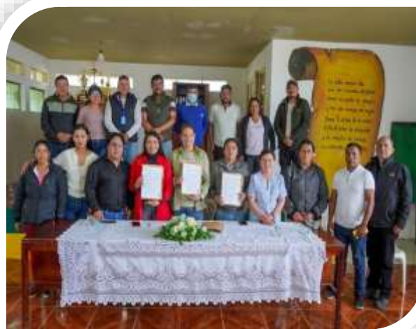
CONVENIO DE COGESTIÓN ENTRE EL GAD PEDRO MONCAYO Y LA EMPRESA FLORSANI S.A.S.