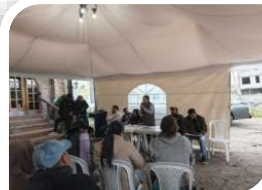
MESA TÉCNICA DE SEGURIDAD MALCHINGUI