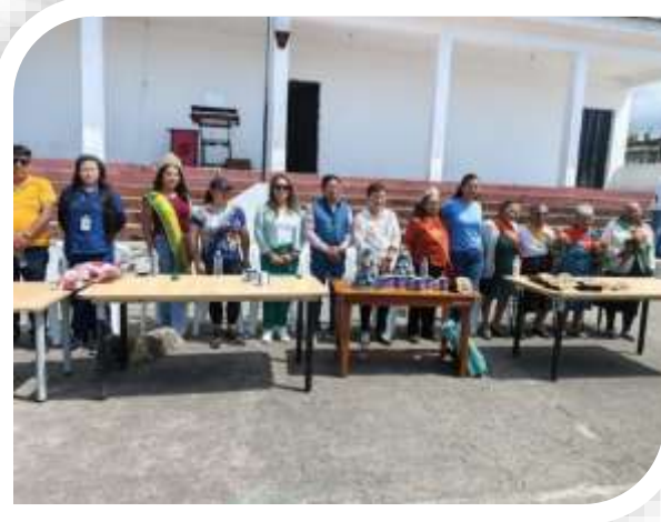
AGASAJO NAVIDEÑO ADULTOS MAYORES MALCHINGUI