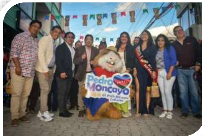
INAUGURACION REGENERACION URBANA