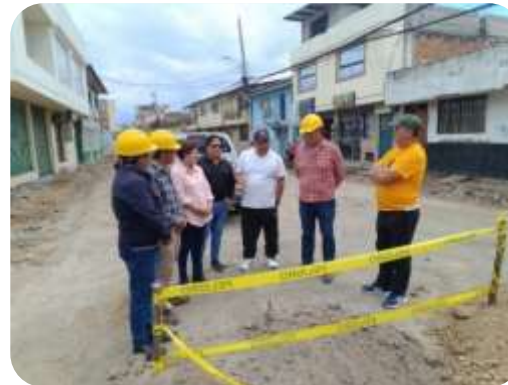
FISCALIZACION CONSTRUCCION ESTACION DE CUERPO DE BOMBEROS- EL BEATERIO MALCHINGUI