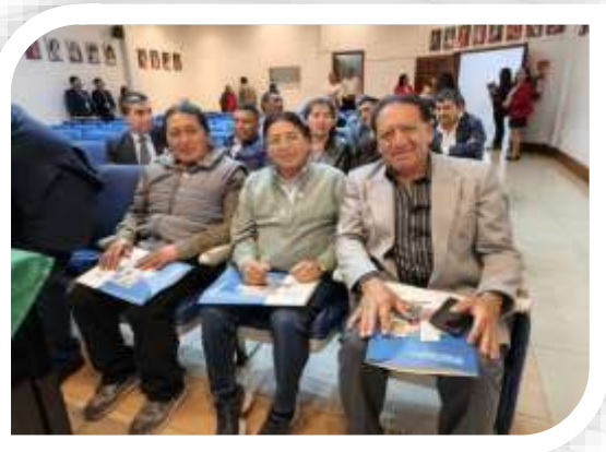
RENDICIÓN DE CUENTAS TREGISTRO DE LA PROPIEDAD Y MERCANTIL