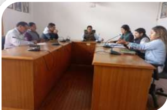
MESA TECNICA UNIFICACION DE LOTES- COMISION DE DESARROLLO CANTONAL