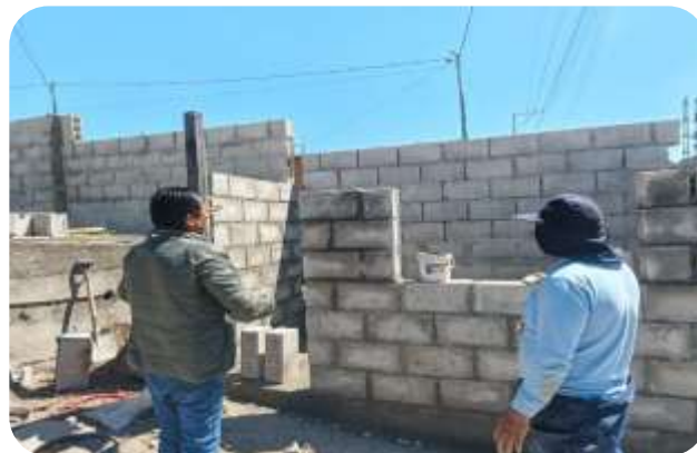
FISCALIZACIÓN CASA COMUNAL GUALLARO CHICO