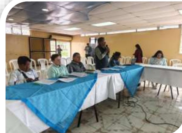
SOCIALIZACIÓN ORDENANZA FLORÍCOLAS