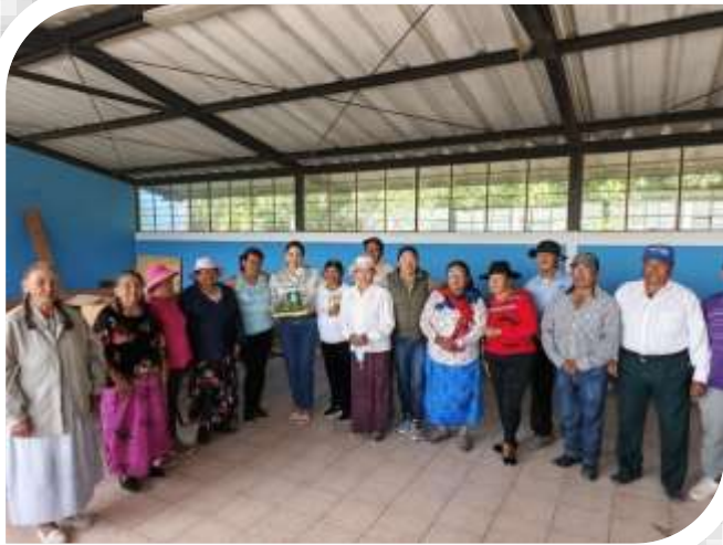
AGASAJO ADULTOS MAYORES NAVIDEÑO TANDA