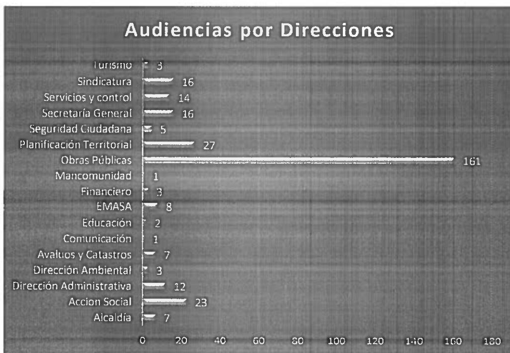
Gráfico 3: Audiencias por Dirección del GADM PM Elaborado: Equipo Técnico

De acuerdo a las necesidades y requerimientos de la ciudadanía que presentan; la alcaldía designa a las direcciones competentes, para que las mismas se responsabilicen, brinden apoyo y cubran las necesidades de la ciudadanía, a continuación se presenta el gráfico en el cual muestra el número que fueron designadas a cada dirección del Gad Municipal.