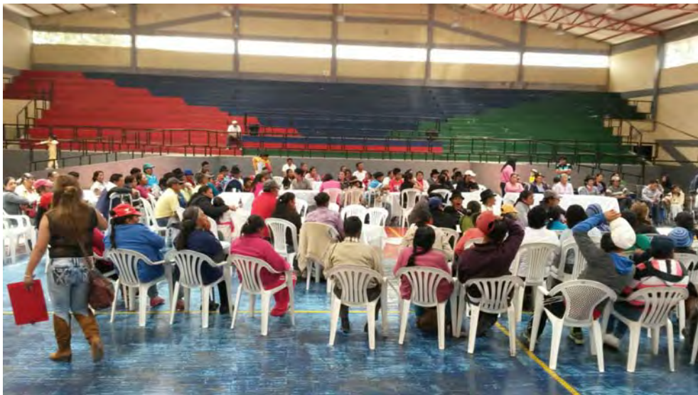
GIRA PEDAGÓGICA BOSQUE PROTECTOR Y PARQUE RECREACIONAL JERUSALEM