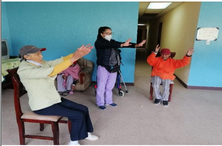
Fotografía 3. EJERCICIOS DE CALENTAMIENTO