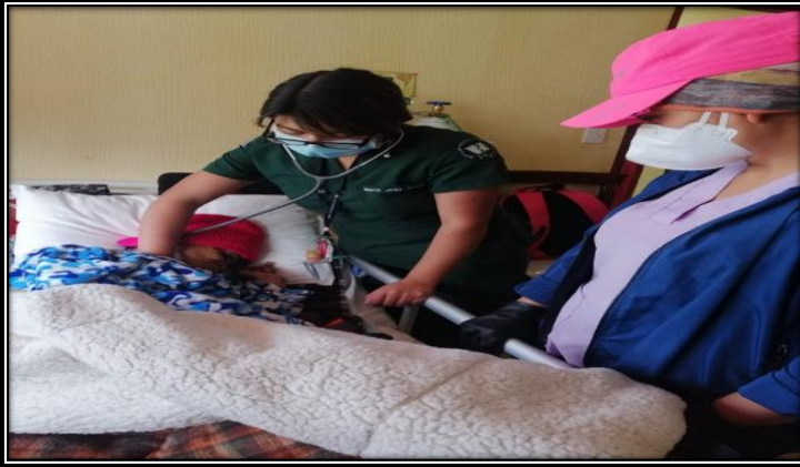
Fotografía 1. ATENCIÓN MÉDICA PROFESIONALES DEL CENTRO DE SALUD TABACUNDO