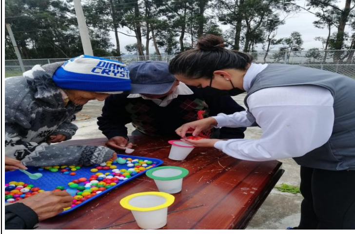
Fotografía 5. CIRCUITOS FÍSICOS Y COGNITIVOS CON LOS ADULTOS MAYORES