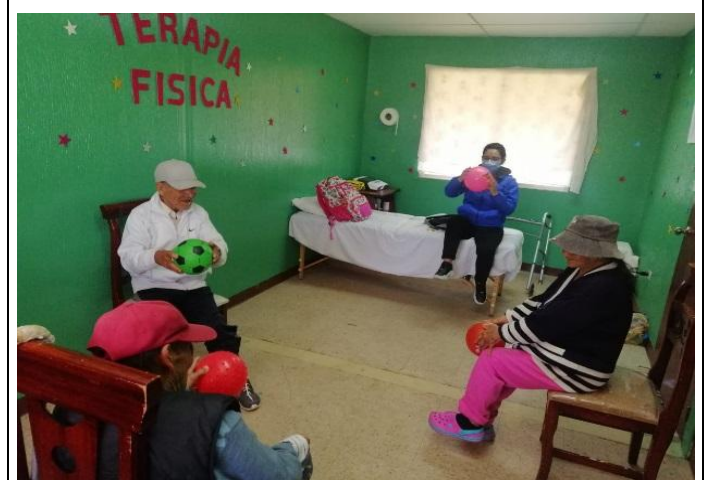
Fotografía 4. GERONTOGIMNASIA