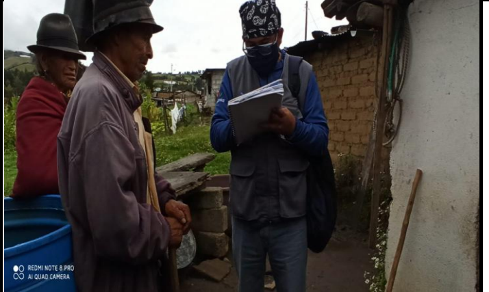
Fotografía 2. VISITA DOMICILIARIA ADULTA MAYOR