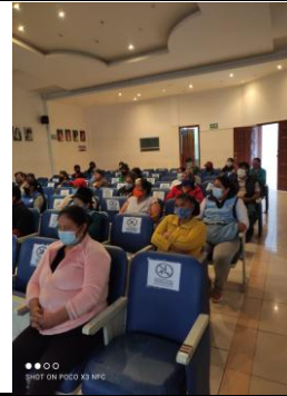
Fotografía 2. Capacitación sobre nueva cepa de COVID 19 a los comerciantes del Mercado Municipal