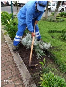
Fotografía 5. Adecantamiento en el parque Bolívar de la parroquia de Maichingui