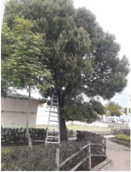
Fotografía 3. Poda de árboles en el parque Tocachi