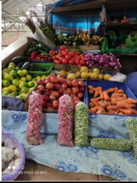
Fotografía 1. Disponibilidad de verduras en el Mercado Municipal