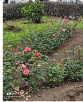
Fotografía 4. Arreglo y mantenimiento del parque Homero Valencia de Tabacundo