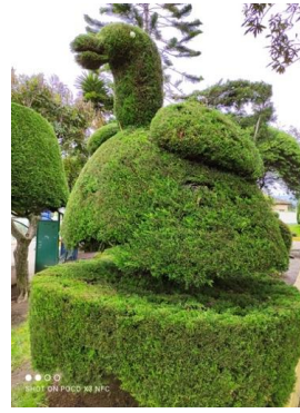
Fotografía 6. Poda y mantenimiento del parque Tupigachi