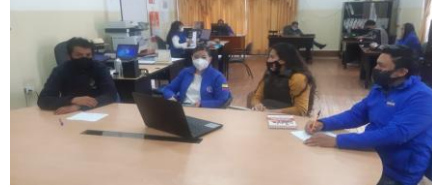
Fotografía 4. Reunión con la Junta Parroquial de La Esperanza para la planificación de capacitaciones en manejo de frutales.