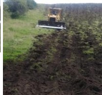
Fotografía 5. Culminación de trabajos de subsolado en la comuna Loma Gorda