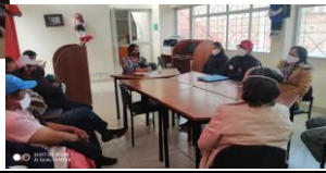
Fotografía 1. Revisión, validación e interpretación de fichas de veedurías realizadas a 88 productores, para certificar granjas agroecológicas.