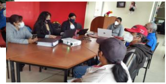
Fotografía 2. Reuniones con el Consejo Cantonal de Productores.