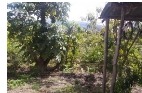
Fotografía 6. Acompañamiento a realizar veedurías a las granjas de productores