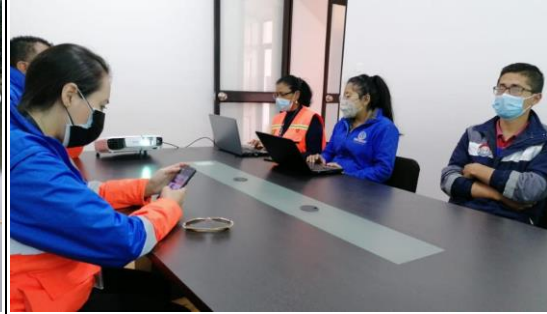
Fotografía 4. Reunión Interinstitucional con el SNGRE