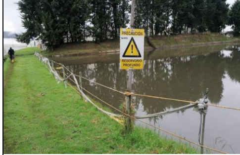
Fotografía 3. Verificaciones de planes de emergencia