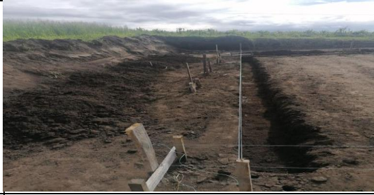
Fotografía 2. Evaluación de riesgos