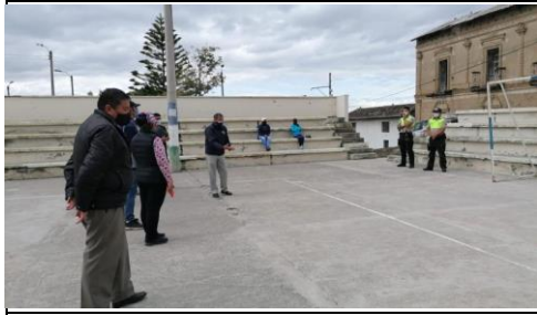
Fotografía 1. COPAE, en la parroquia de Tocachi