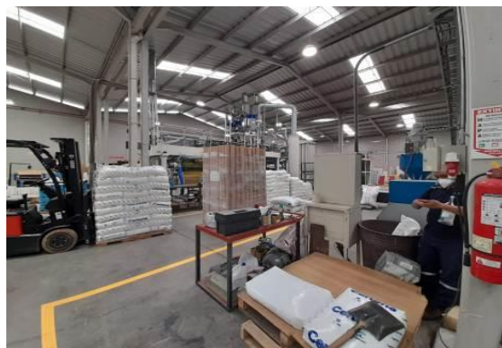
Fotografía 4. Inspección de una fabrica de productos plásticos