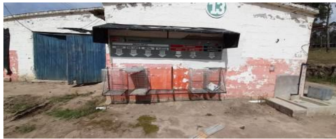
Fotografía 3. Inspección de una avícola