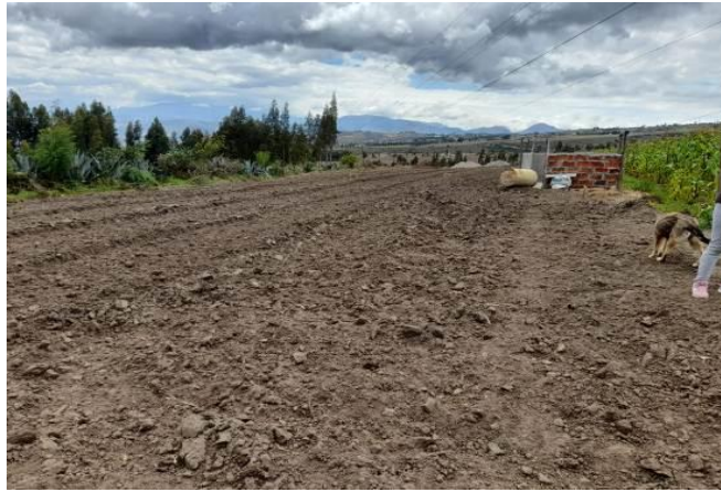
Fotografía 2. Inspección de la implantación de invernaderos