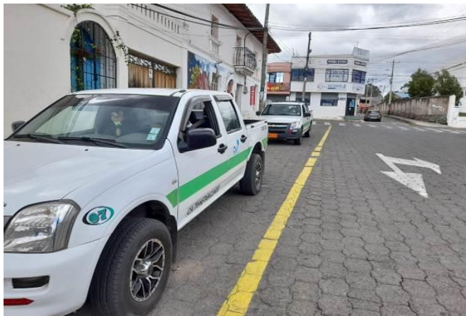
Fotografía 1. Inspección de una compañía de camionetas