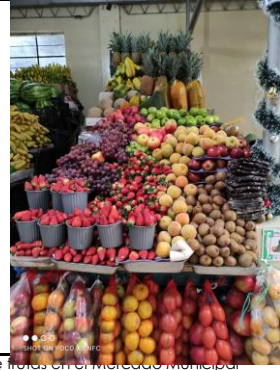
Fotografía 2. Disponibilidad de frutas en el Mercado Municipal