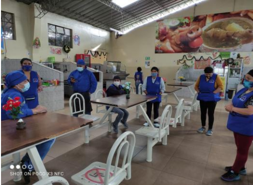
Fotografía 5. Reunión de comerciantes en la sección comidas del Mercado Municipal