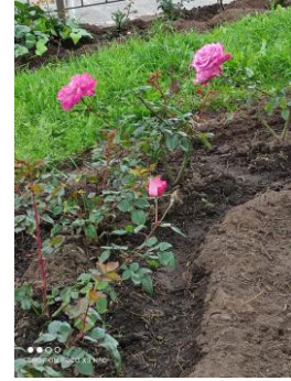
Fotografía 4. Arreglo y mantenimiento del parque Homero Valencia de Tabacundo