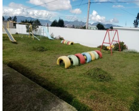
Fotografía 6. Poda de césped en el Centro Infantil de Malchingui