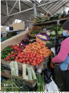
Fotografía 1. Disponibilidad de verduras en el Mercado Municipal