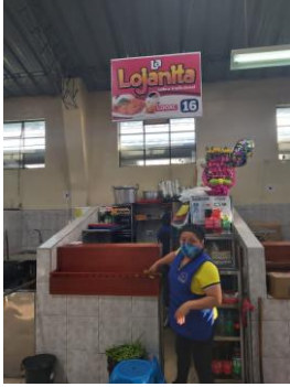
Fotografía 3. Marca comercial La loanita