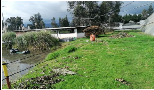
Fotografía 2. Evaluación de riesgos