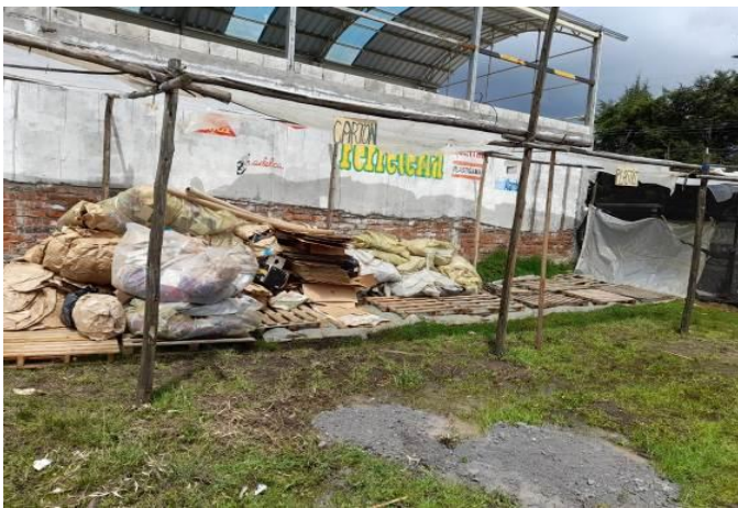
Fotografía 1. Inspección de una recicladora