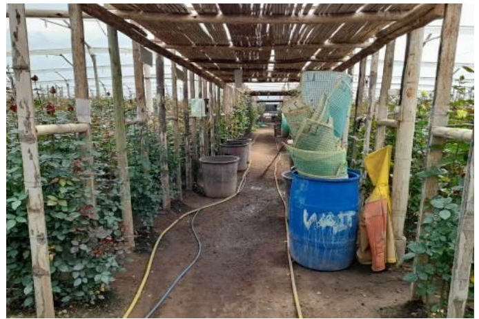
Fotografía 2. Inspección de pequeñas florícolas