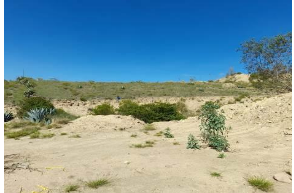
Fotografía 4. Inspección de áreas mineras