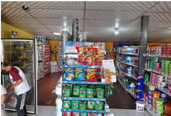
Fotografía 3. Inspección de una tienda de víveres al por menor