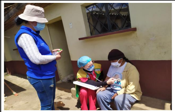
Fotografía 2. Coordinación con el médico del barrio