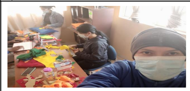
Fotografía 4. Elaboración de presente para los adultos mayores por navidad