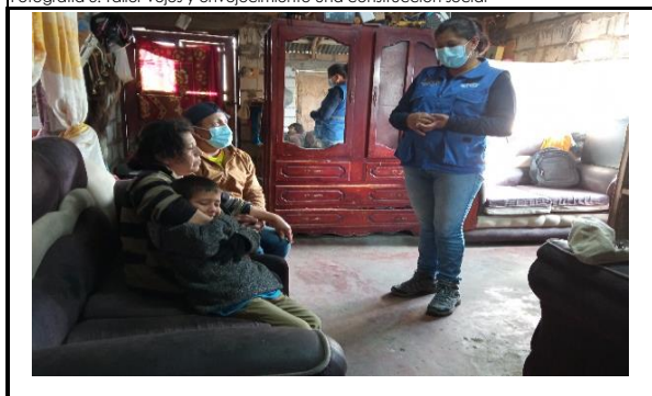
Fotografía 5. Réplica de taller a familiares de los adultos mayores