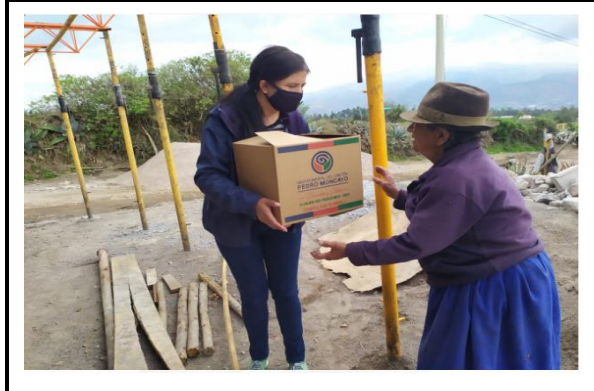
Fotografía 1. Entrega de kits a usuarios del proyecto adulto mayor