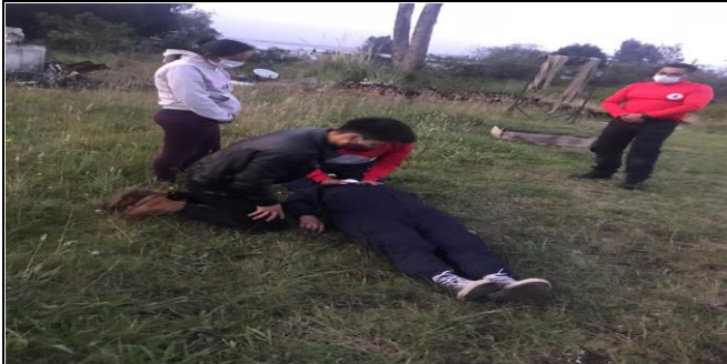
Fotografía 5. Capacitación en primeros auxilios a aspirantes a protección civil