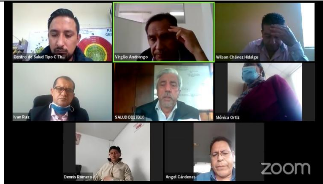
Fotografía 2. Reuniones del COE Cantonal