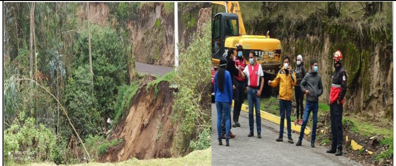
Fotografía 6. Evaluación de Riesgos en la quebrada del Pimán