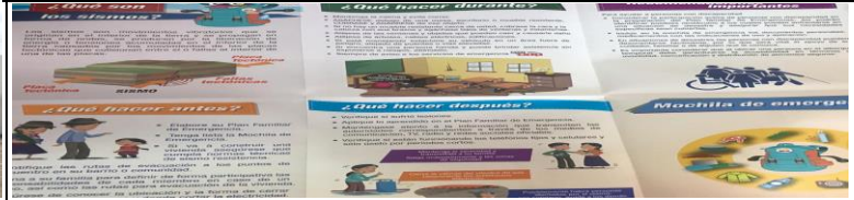
Fotografía 4. Campañas de Prevención de riesgos y emergencias mediante trípticos