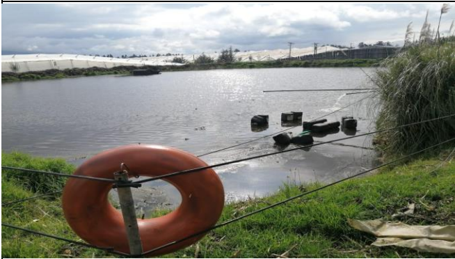
Fotografía 1. Verificaciones de planes de emergencias y desastres