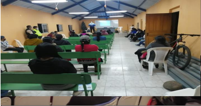
Fotografía 1. Capacitación de Seguridad Ciudadana Barrio la Alegría