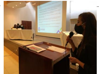
Socialización de Ordenanza