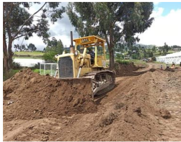
Socialización de obras