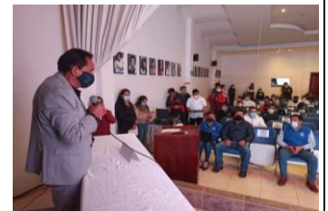
Actualización matriz componente Político, Institucional y Participación Ciudadana (PDOT)