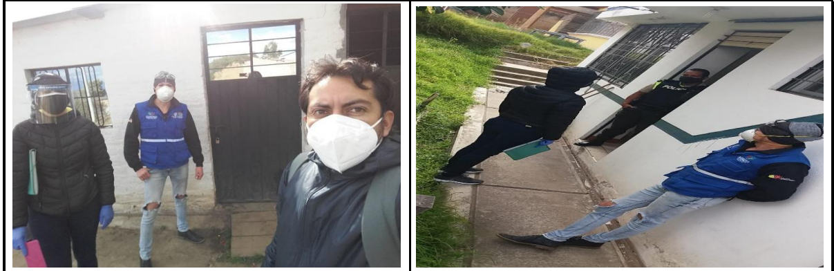
Fotografía 1. Intervista del Equipo para levantamiento de información adulta mayor