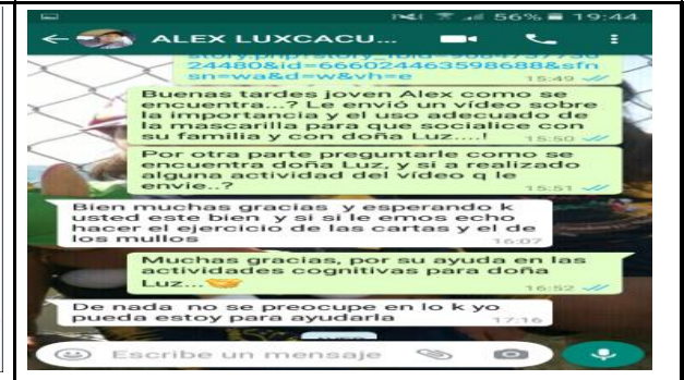
Fotografía 6. Seguimiento a los usuarios del proyecto adulto mayor