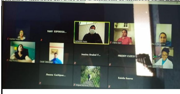
Fotografía 3. Reunión del equipo técnico