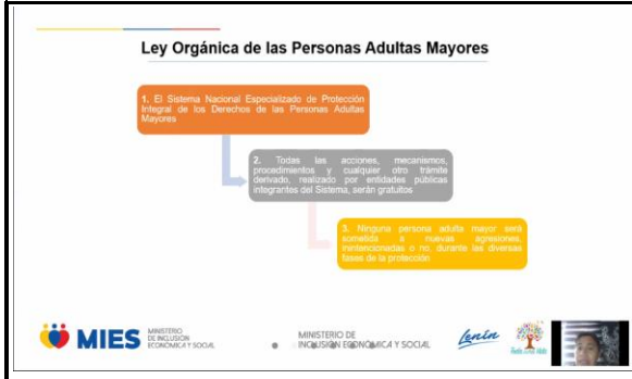
Fotografía 5. Ley Organica de las personas adultas mayores.