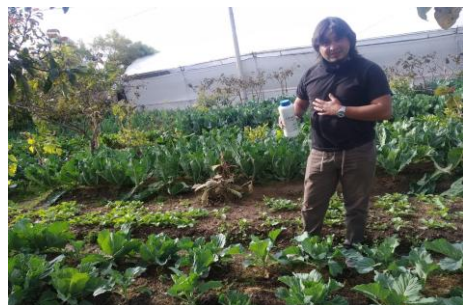
Fotografía 2. Ensayos de control con productos orgánicos de Limaco o Babosas en los cultivos de hortalizas de los productores agroecológicos.