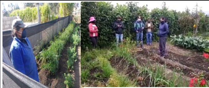
Fotografía 6. Acompañamiento y asesoramiento técnico a productores agroecológicos del cantón Pedro Moncayo