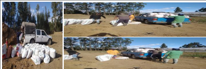
Fotografía 4. Coordinación y entrega de abono (pollinaza) a productores agroecológicos del Cantón Pedro Moncayo. Comunidades de San Lui de Itchisi, Buen Vivir, Uccopem.