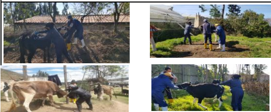
Fotografía 3. Coordinación y acompañamiento en la campaña de Vacunación contra el Carbunco .