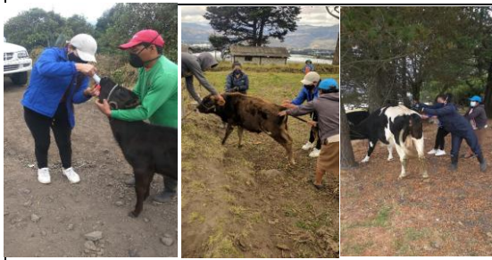
Fotografía 5. . Coordinación y acompañamiento en la campaña de Vitaminización y desparasitación en Bovinos .