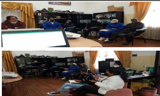
Fotografía 1. Charlas sobre Macroproyectos