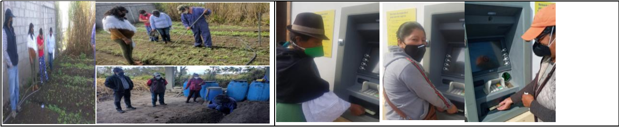
Fotografía 7. Visita a productores agroecológicos y validación de fichas para realizar las veedurías.