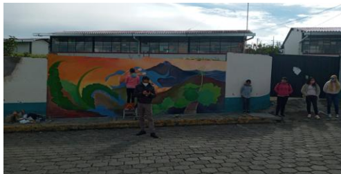
Fotografía 3. Parroquia de Tupigachi