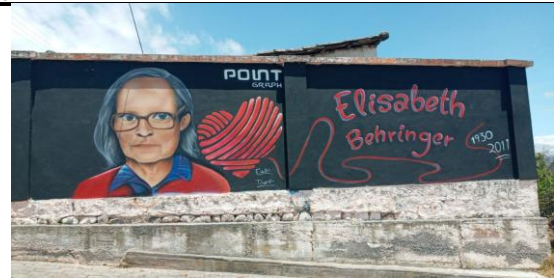
Fotografía 2. Parroquia de Tocachi