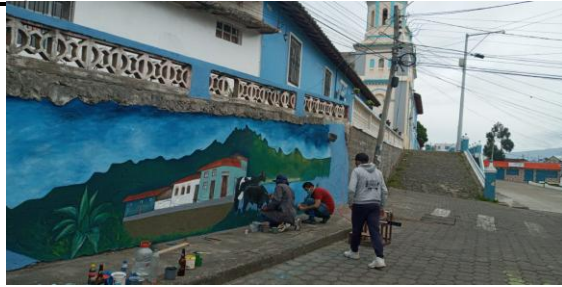
Fotografía 1. Parroquia de la Esperanza