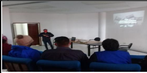
Fotografía 3. Taller de primeros auxilios impartido por el MIES