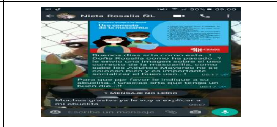
Fotografía 4. Mediante WhatsApp se informaron de buen uso de la mascarilla