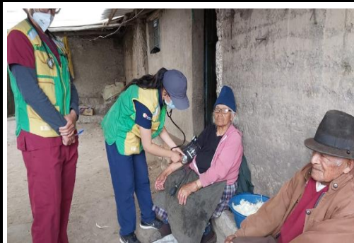
Fotografía 1. Coordinación de visita del médico del barrio para los usuarios del proyecto