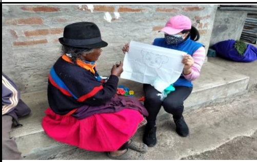
Fotografía 5. Mediante las indicaciones se mejora la motricidad