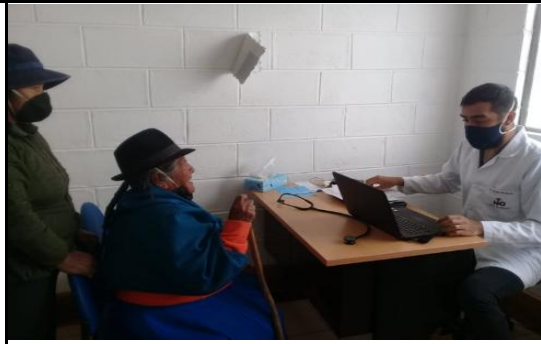
Fotografía 2. Coordinación con el Ministerio de Salud Pública.