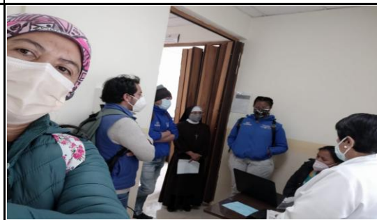
Fotografía 6. Coordinación interinstitucional de los usuarios del proyecto