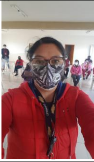
Fotografía 5. Capacitación a la Asociación Agropecuaria Tomalón.