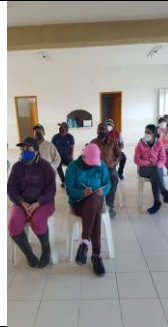
Fotografía 6. Productores asistentes al taller sobre manejo y disposición final de envases vacíos.