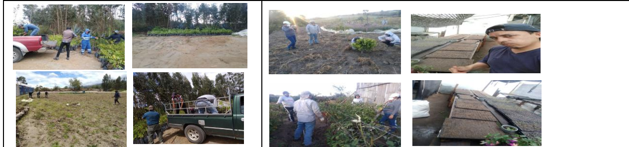
Fotografía 1. Entrega de plantulas arbustivas gestionadas al GAD Provincial - Jerusalem, para el área de Medio Ambiente, Accion Social del GADMPMy la Comunidad de Cananvalle.