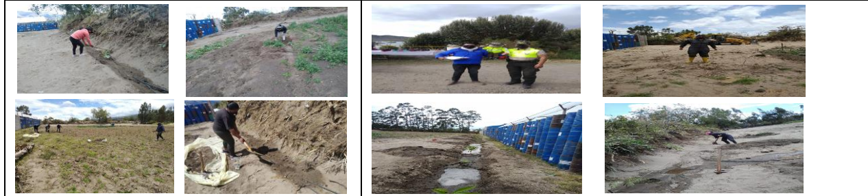
Fotografía 5. Actividades realizadas por infractores sancionados y su servicio comunitario en el terreno .unicipal de puruhantag. .