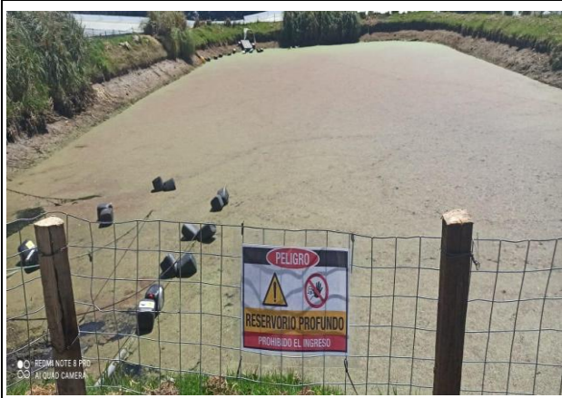
Fotografía 1. Verificaciones de planes de emergencias y desastres