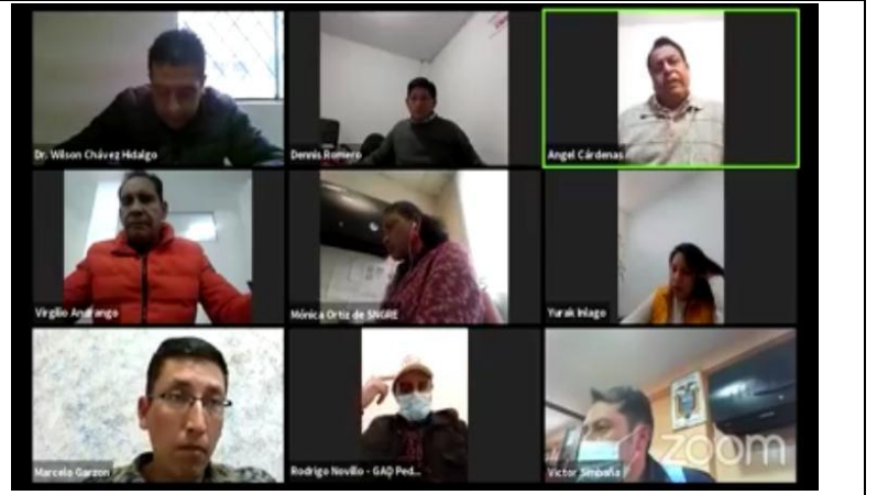
Fotografía 2. Reuniones del COE Cantonal