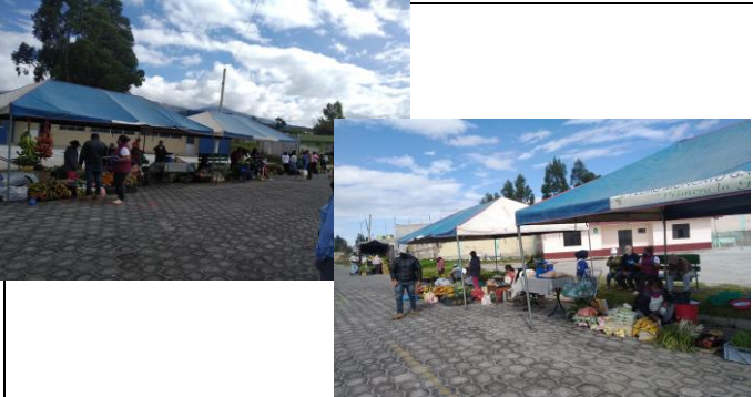
Fotografía 5. Coordinación desarrollo de la Feria En el barrio el Rosario (La Esperanza)