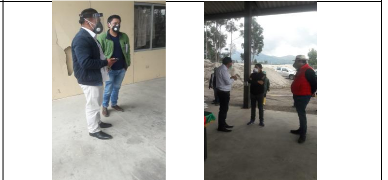
Fotografía 6. Recepción de abonos solicitados a la Prefectura de Pichincha.