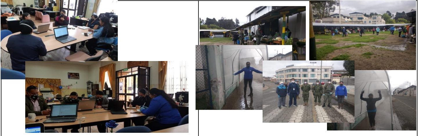
Fotografía 1. Reunión de equipo para la planificación de actividades semanales