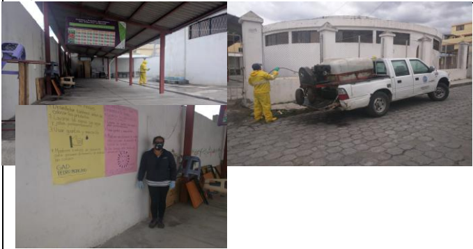
Fotografía 3. Coordinación de la Fumigación de la Ferias El Buen Vivir y UCCOPEM