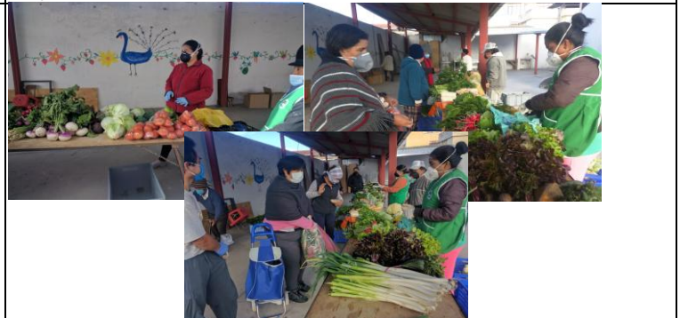
Fotografía 4. Coordinación desarrollo de la Feria El Buen Vivir