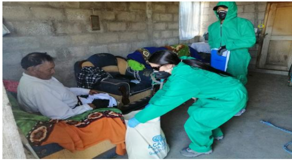
Entrega de kits alimenticios por emergencia sanitaria