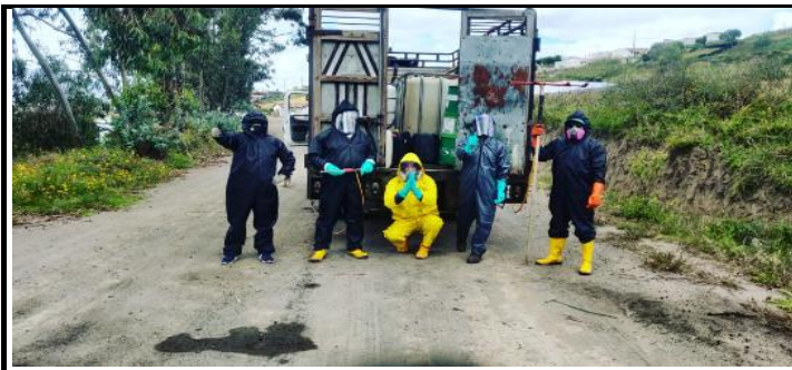
Fotografía 3.- Coordinación de la desinfección y fumigación en los barrios y comunidades que poseen contagios de COVID -19.