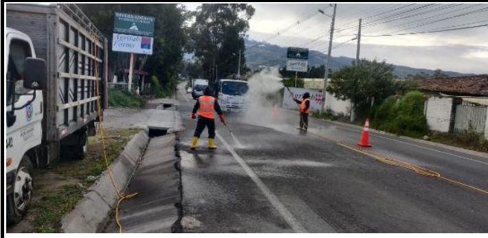
Fotografía 1.- Coordinación de la desinfección y fumigación de vehículos que ingresan al Cantón en el punto del río Granobles