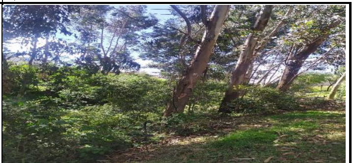
Fotografía 4.- Inspecciones a talas ilegales