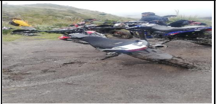
Fotografía 2.- Coordinación con los guardabosques municipales, con el fin de restringir el ingreso a personas, al Área de Conservación y Uso Sustentable Mojanda, debido a la pandemia del COVID-19.