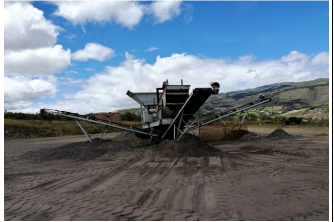
Fotografía 2. Trituradora móvil ubicada dentro del área "Pedregal de Tomalón",