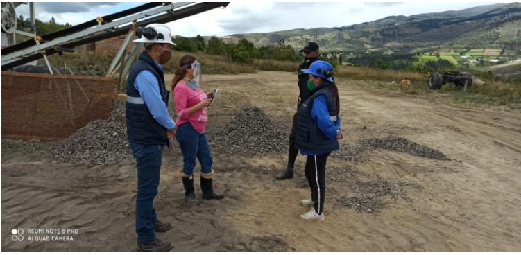
Fotografía 1. Inspección al área "Pedregal de Tomalón", código 100000348.