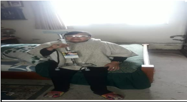
Fotografía 5. Entrega de ayudas técnicas a los usuarios.