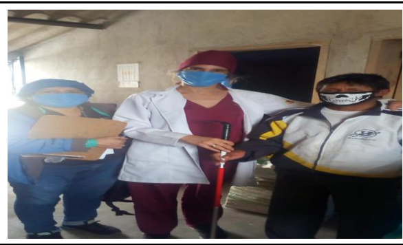
Fotografía 6. Entrega de ayudas técnicas por parte del sub Centro de Salud.