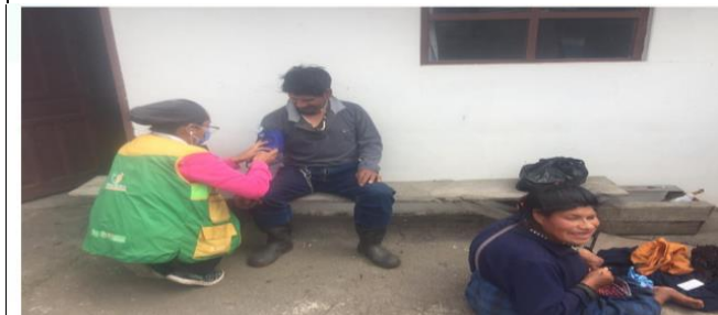
Fotografía 3. Chequeo médico por parte del médico del barrio.