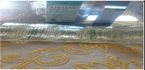
Fotografía 4. Agendamiento y entrega de medicamentos.