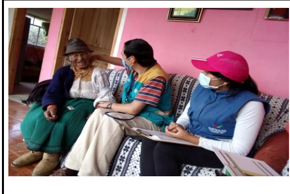
Fotografía 1. Coordinación con médico del barrio visitas domiciliarias