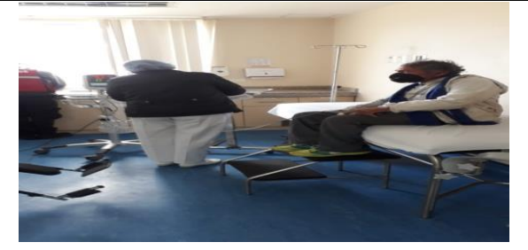
Fotografía 4. Acompañamiento al adulto mayor al centro de salud