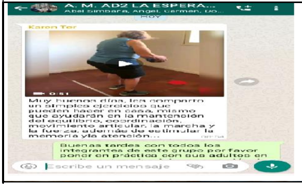
Fotografía 5. Videos de Terapias Ocupacionales dirigidos para los adultos mayores