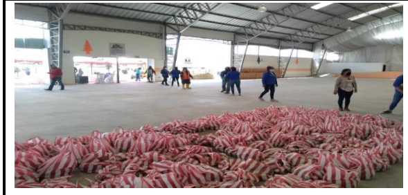
Fotografía 3. Apoyo en la elaboración de kits de alimentación