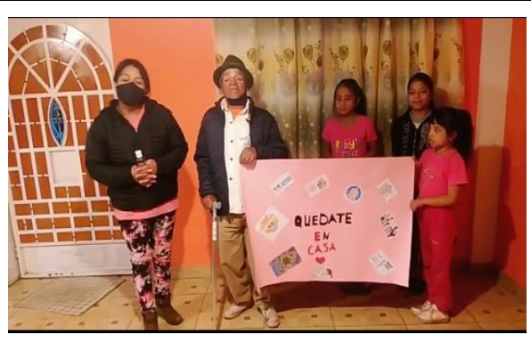
Fotografía 2. Educar a los adultos la importancia de quedarse en casa.