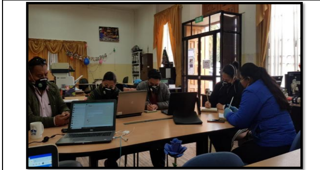
Fotografía 5. Trabajo en oficina en los diferentes proyectos como Dirección de Desarrollo Económico y Turismo