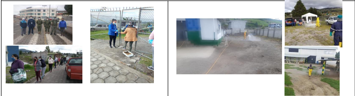
Fotografía 1. Acompañamiento de inicio a fin en las distintas ferias agroecológicas y comunitarias del cantón Pedro Moncayo