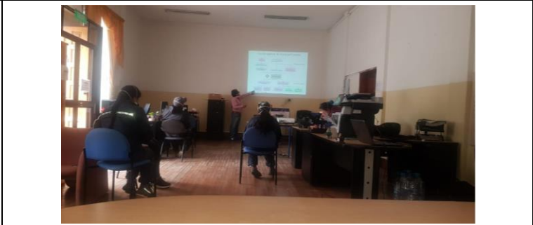
Fotografía 6. Capacitación en construcción de proyectos para la obtención de fondos concursables no reembolsables.