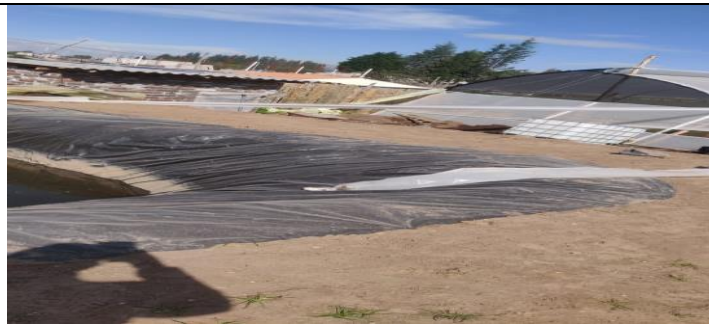
Fotografía 1.- Atención a denuncias referente a Calidad Ambiental.