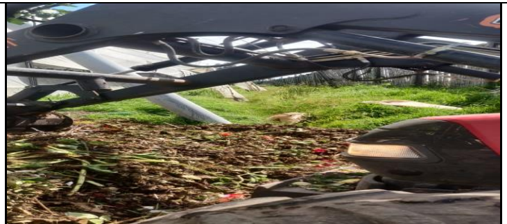
Fotografía 2.- Atención a denuncias referente a Calidad Ambiental.