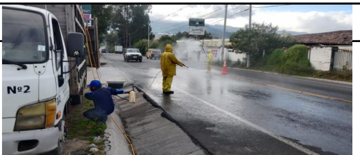
Figura 3.- Coordinación de la desinfección y fumigación de vehículos que ingresan al Cantón en el punto del río Granobles