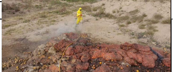
Fotografía 4.- Coordinación de la desinfección y fumigación en los barrios y comunidades que poseen contagios de COVID -19.