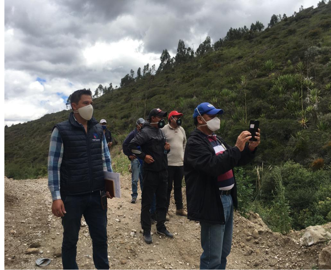
Fotografía 2. Inspección conjunta con los concejales al área "Las Rosas", código 490950.