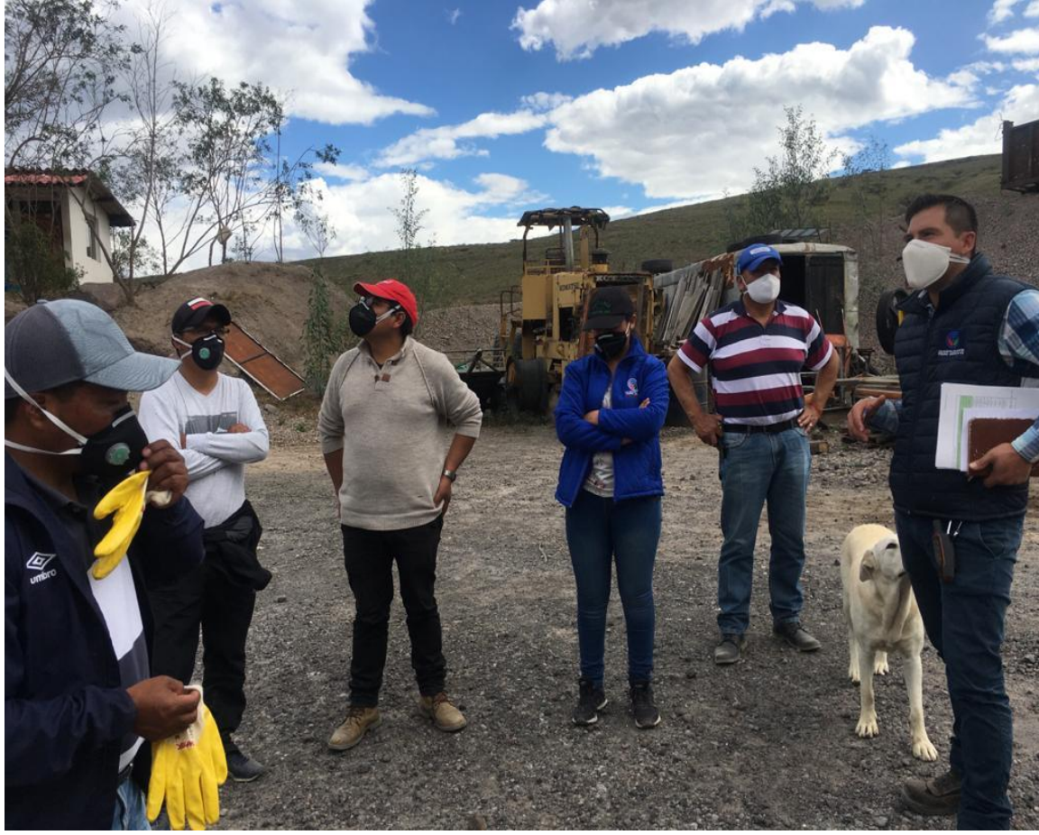
Fotografía 1. Inspección conjunta con los concejales al área "José", código 401800.