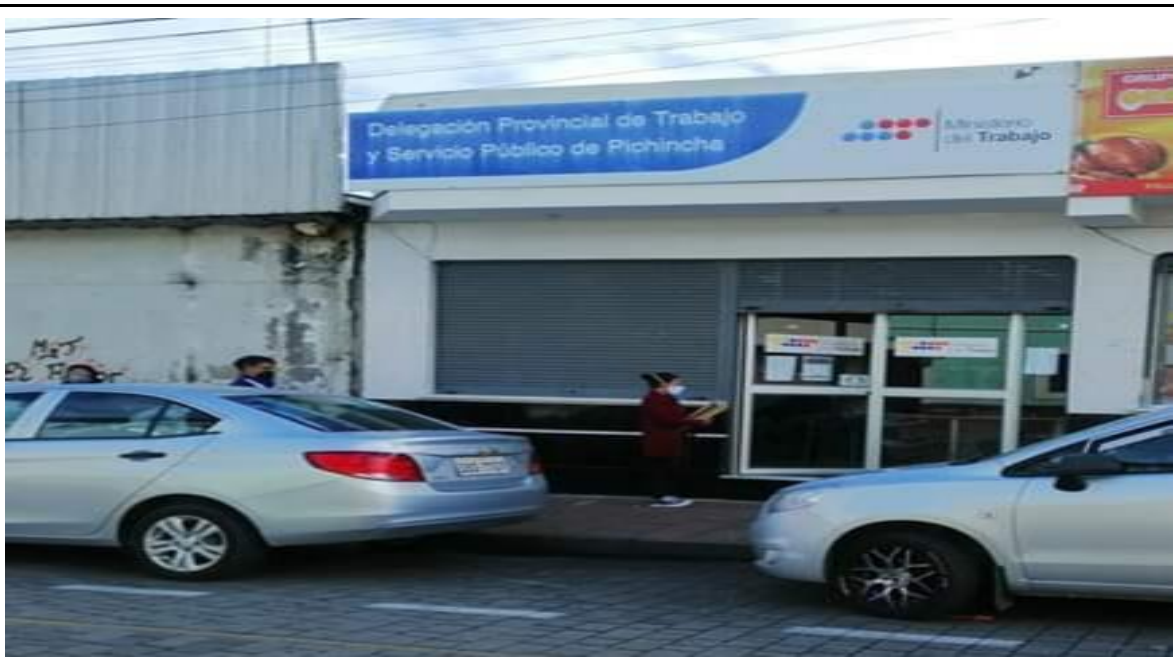
Fotografía 6. INICIO DE PROCESOS DE CITACIÓN LABORAL EN EL MINISTERIO DE TRABAJO EN FAVOR DE GAP