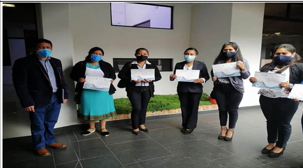
Fotografía 5. PARTICIPACIÓN EN EL RECONOCIMIENTO OTORGADO AL GAD PEDRO MONCAYO COMO INSTITUCIÓN SEGURA LIBRE DE VIOLENCIA CONTRA LA MUJER