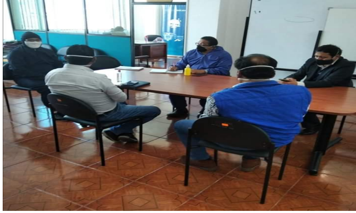
Fotografía 2. REUNIÓN DISTRITO DE EDUCACIÓN PARA TRATAR TEMAS RELACIONADOS A LOS DERECHOS DE NNA