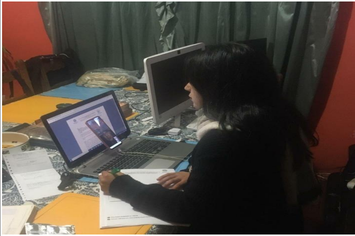
Fotografía 3. ASESORAMIENTO PSICOLÓGICO CASOS DE VULNERACIÓN DE GAP