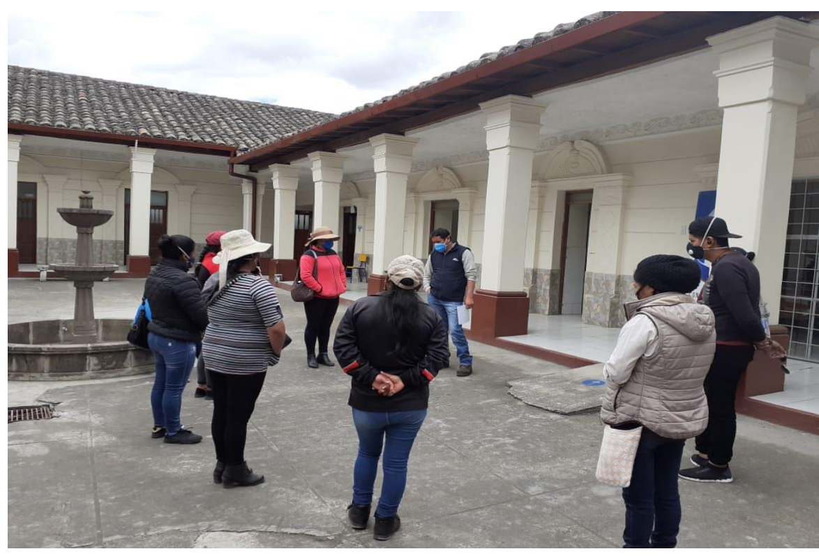
Fotografía 4. ASESORAMIENTO LEGAL A EX TRABAJADORES DE FLORÍCOLAS DE PEDRO MONCAYO