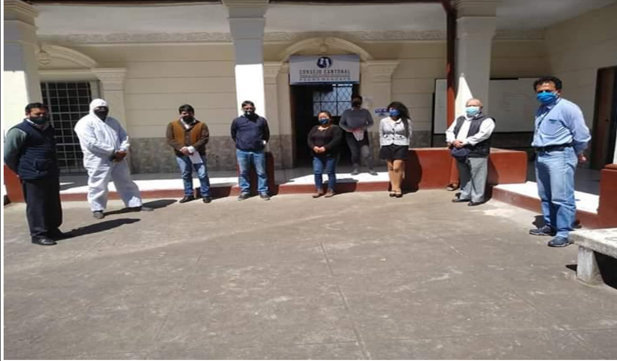
Fotografía 1 .- POSESIÓN DE MIEMBROS DE LA SOCIEDAD CIVIL DEL CCPDGAP-CPM