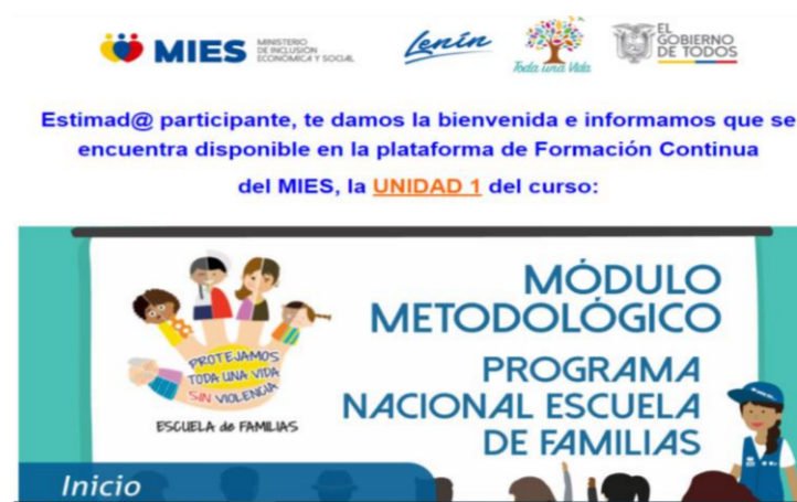
Fotografía 4. Inicio de Módulo de Formación Continua sobre programa nacional de escuela de familias. MÓDULO METODOLÓGICO.