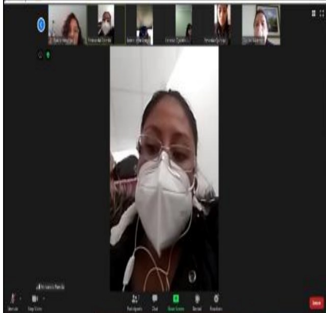
Fotografía 5. participación en las video conferencias con el equipo técnico