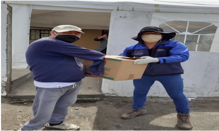
Fotografía 1. Apoyo GAD Municipal de Pedro Moncayo, Dirección de Acción Social y Grupos Prioritarios; para la entrega de Kits alimenticios a personas con discapacidad en condiciones