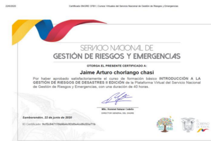
Fotografía 2. Aprobación del curso de formación virtual del Servicio Nacional de Gestión de Riesgos y Emergencias, denominado: Introducción a la gestión de riesgos II