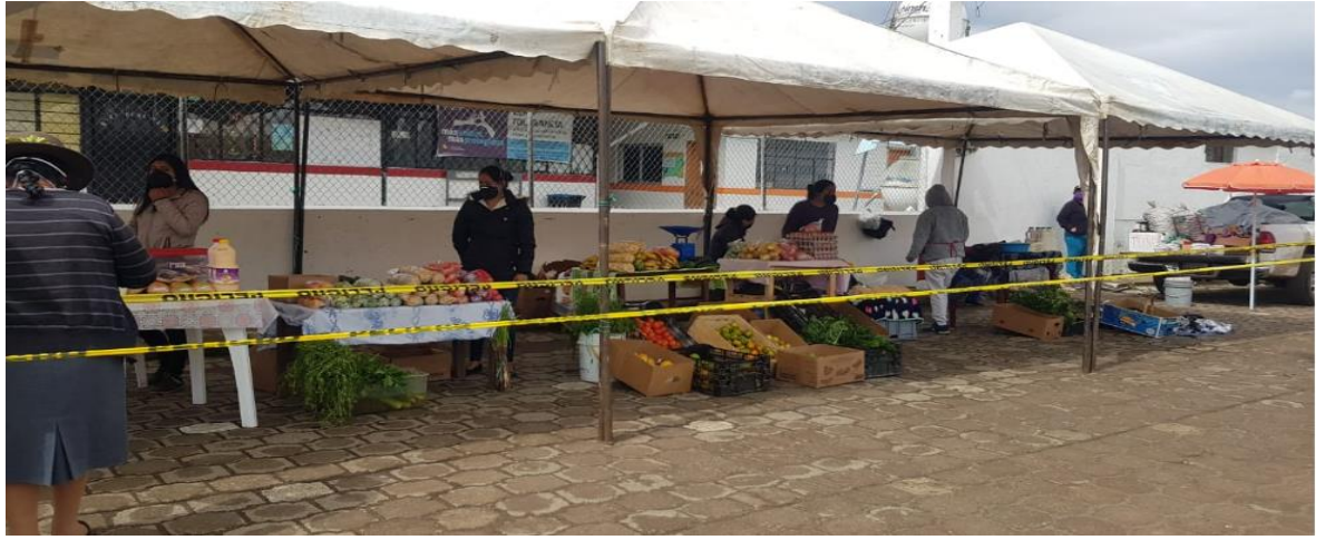
Fotografía 4. Asistencia a ferias