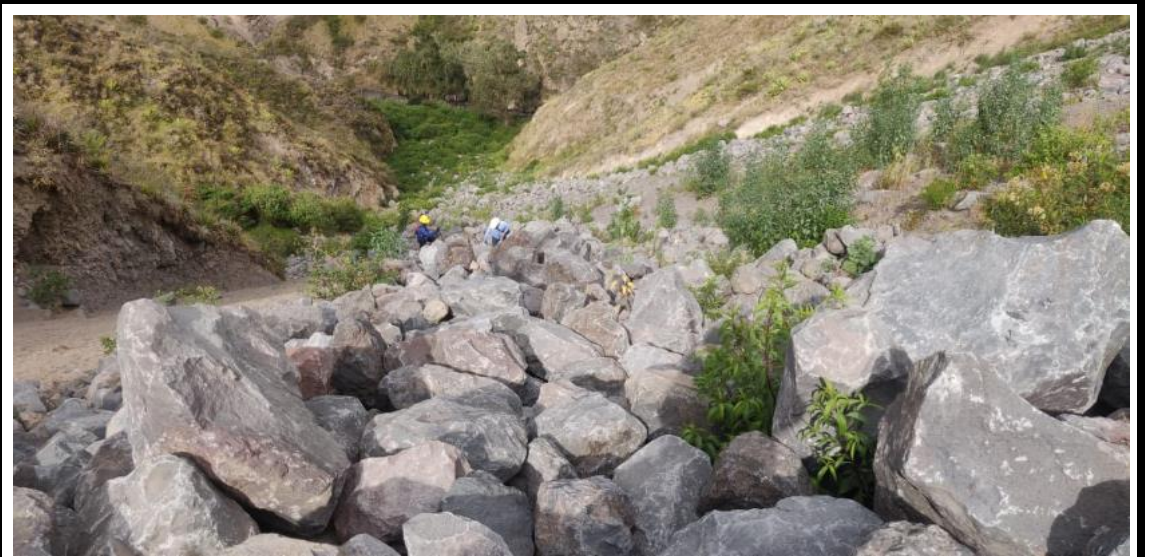
Figura 2.- Inspecciones de control de las áreas de protección "quebradas"