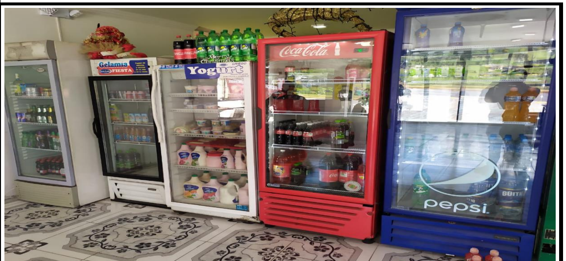
Fotografía 4.- Atención a denuncias referente a Calidad Ambiental.