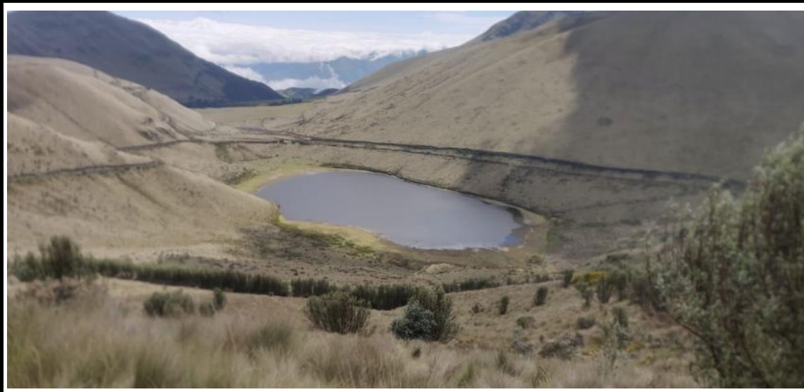
Figura 1.- Inspecciones de control del ACUS Mojanda.