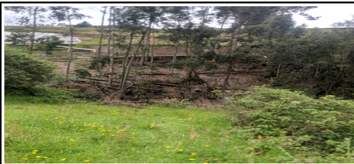
Figura 2.- Inspecciones de actividades ilícitas de alto impacto ambiental en áreas de protección municipal.