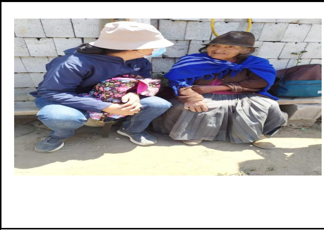
Fotografía 1. Seguimiento mediante visitas domiciliarias