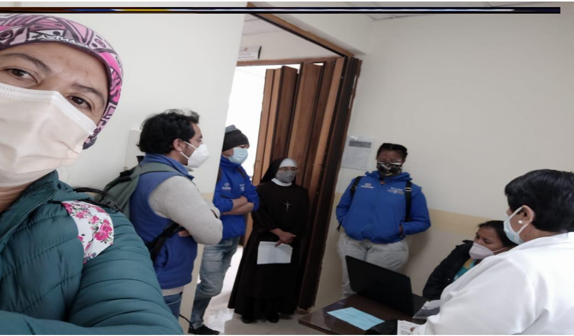
Fotografía 6. Coordinación interinstitucional con el MSP para entrega de medicamentos