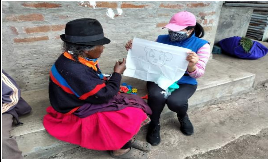
Fotografía 5. Mediante la indicaciones se mejora la motricidad