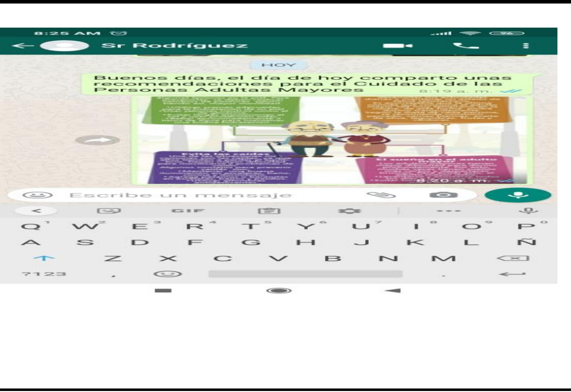
Fotografía 2. Recomendaciones para el cuidado de los Adultos Mayores