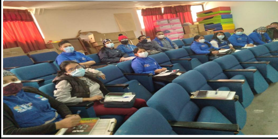
Fotografía 3. Reunión del equipo técnico para coordinar trabajos