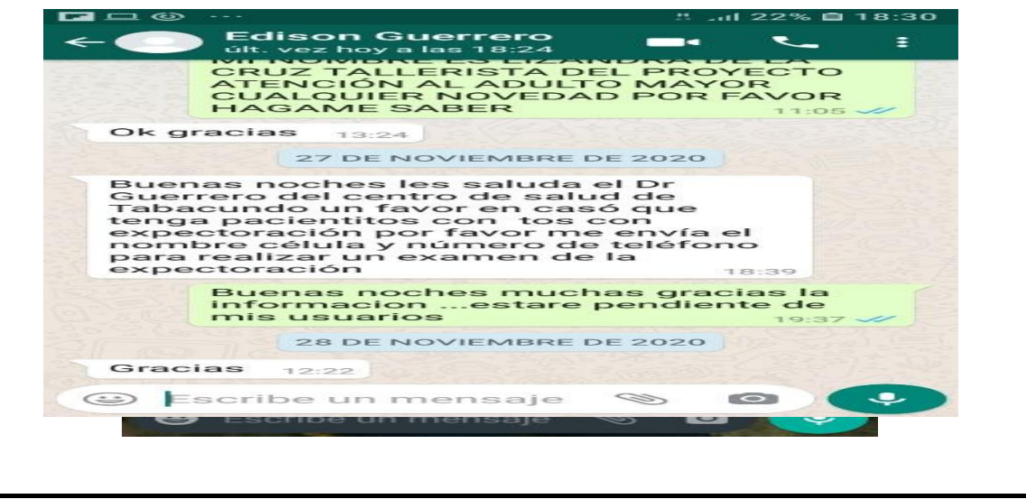
Fotografía 4. Mediante WhatsApp se da seguimiento diario a los adultos mayores