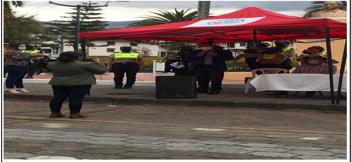
Seguridad Ciudadana y violencia intrafamiliar