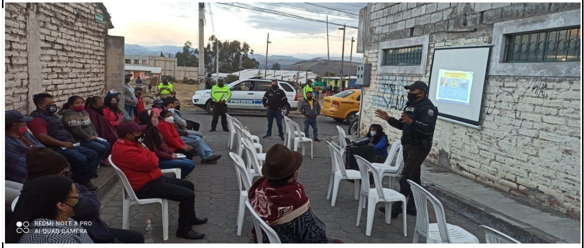
Fotografía 2. Capacitacion Barrio el Tambo