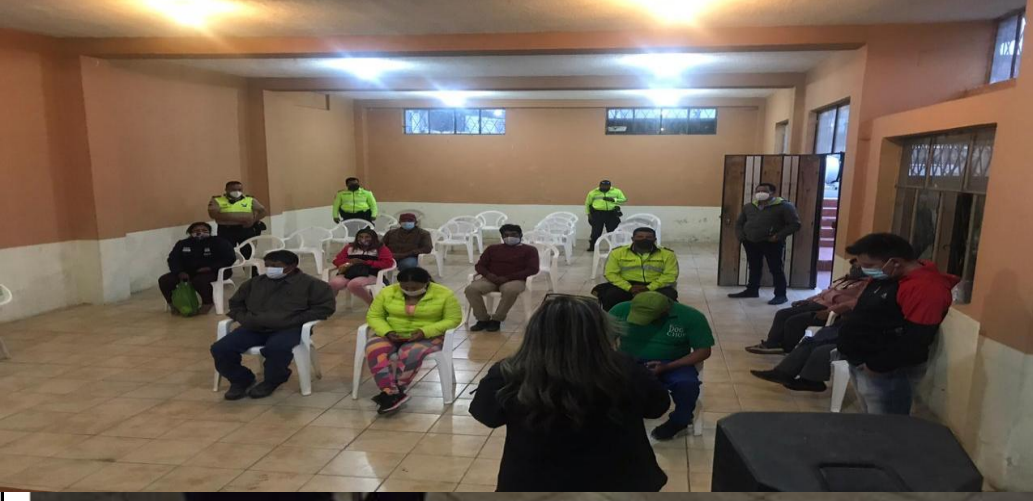
Fotografía 1. Capacitación de Seguridad Ciudadana Barrio la Y de Tabacundo