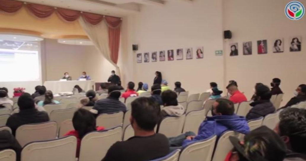
Fotografía 3. Actualización del Plan de convivencia y segruidad ciudadana con