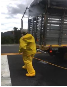
Fotografía 1. Fumigación a los vehículos de ingreso a la parroquia de Tabacundo