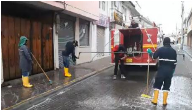
Fotografía 5. Fumigación a la ciudad de Tabacundo