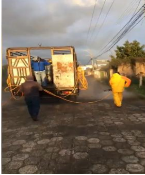
Fotografía 3. Fumigación a la ciudad de Tabacundo