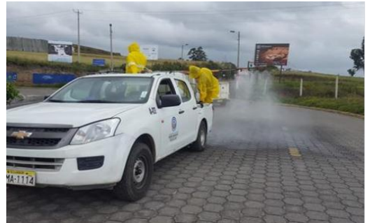
Fotografía 4. Fumigación al sector periurbano de Tabacundo