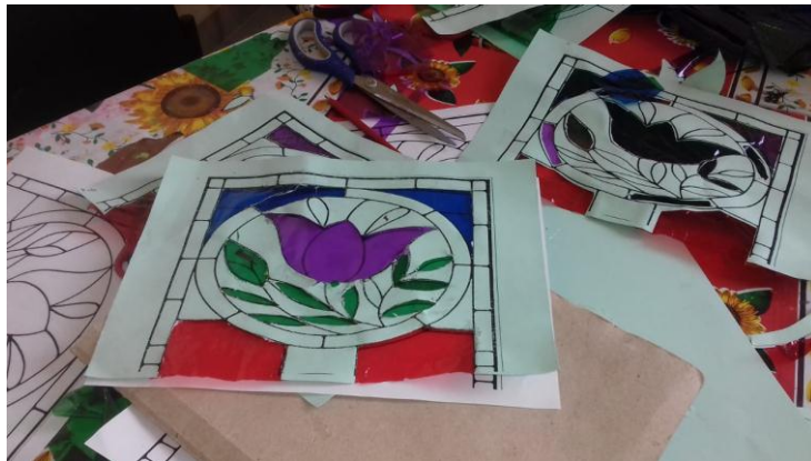
Fotografía 2. terapias ocupacionales