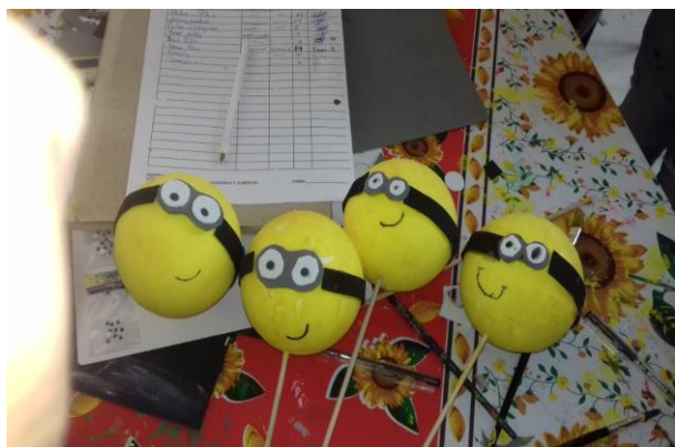
Fotografía 1. terapias ocupacionales