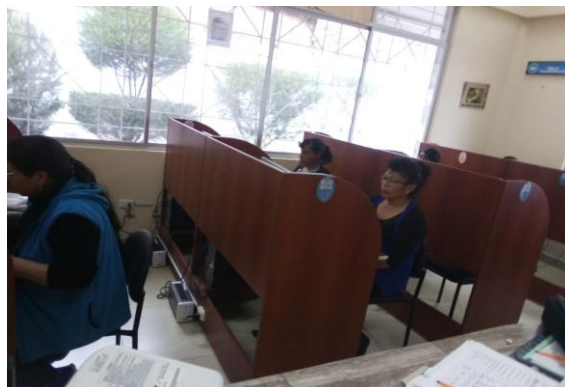
Fotografía 4. alfabetización digital