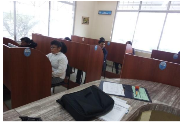
Fotografía 6. servicio de internet