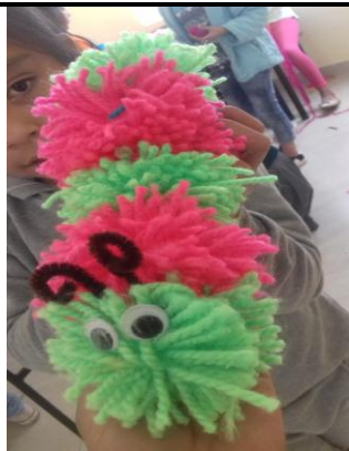
Fotografía 3. terapias ocupacionales