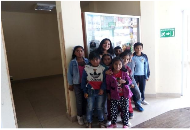
Fotografía 5. tareas dirigidas