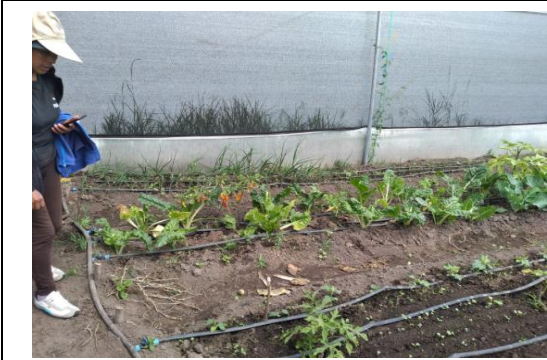
Fotografía 3. Levantamiento Fichas de turismo, y enviadas al MINTUR para su revision y validacion