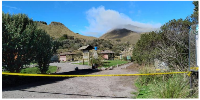
Fotografía 4. Monitoreo del Complejo Lacustre Mojanda