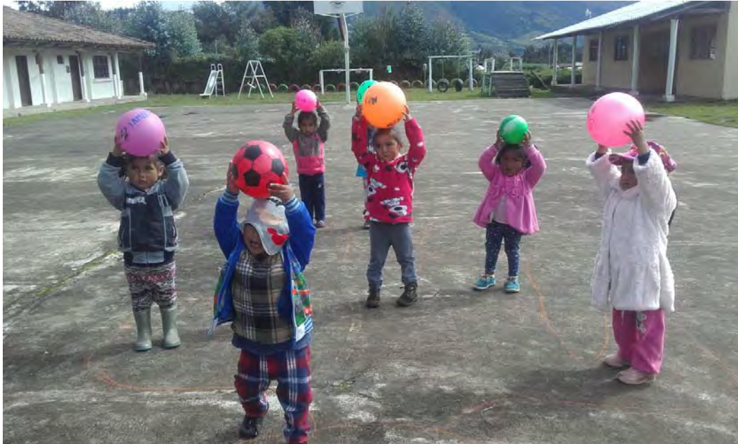
Niños y niñas del CIBV Kuri Sisa desarrollando el área motriz gruesa