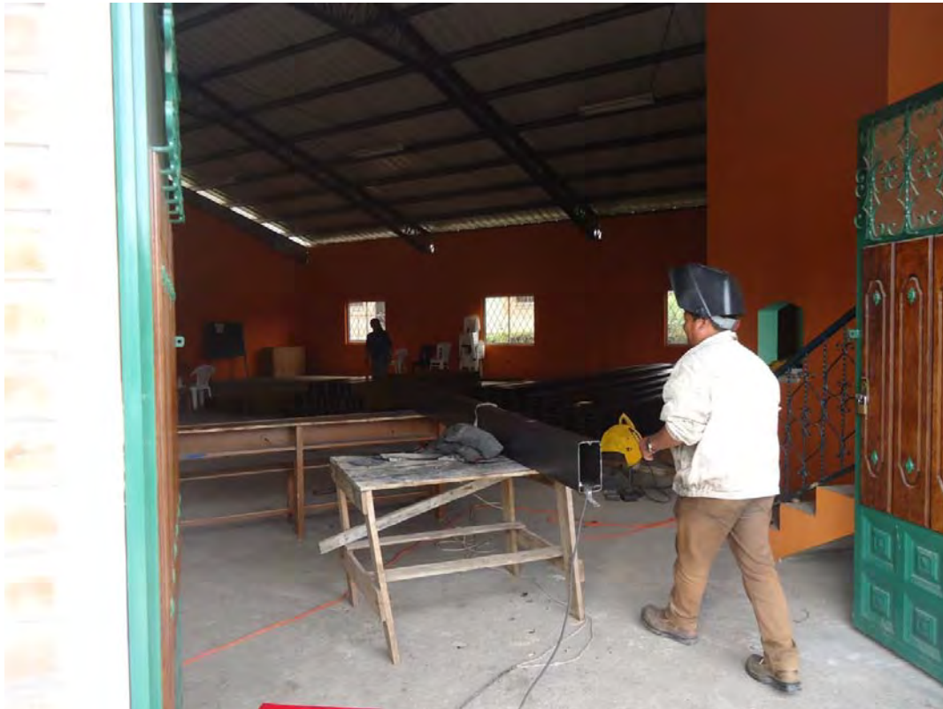
INICIO CONSTRUCCIÓN DEL CENTRO INFANTIL “VIDA NUEVA” COMUNIDAD DE LUIS FREIRE

UNIDAD DE PROTECCIÓN ESPECIAL PROYECTO DESARROLLO INFANTIL