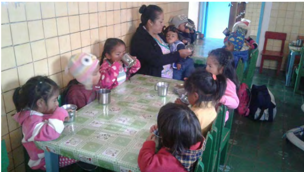
Niños y niñas del CIBV Luz y Vida recibiendo su primera ingesta