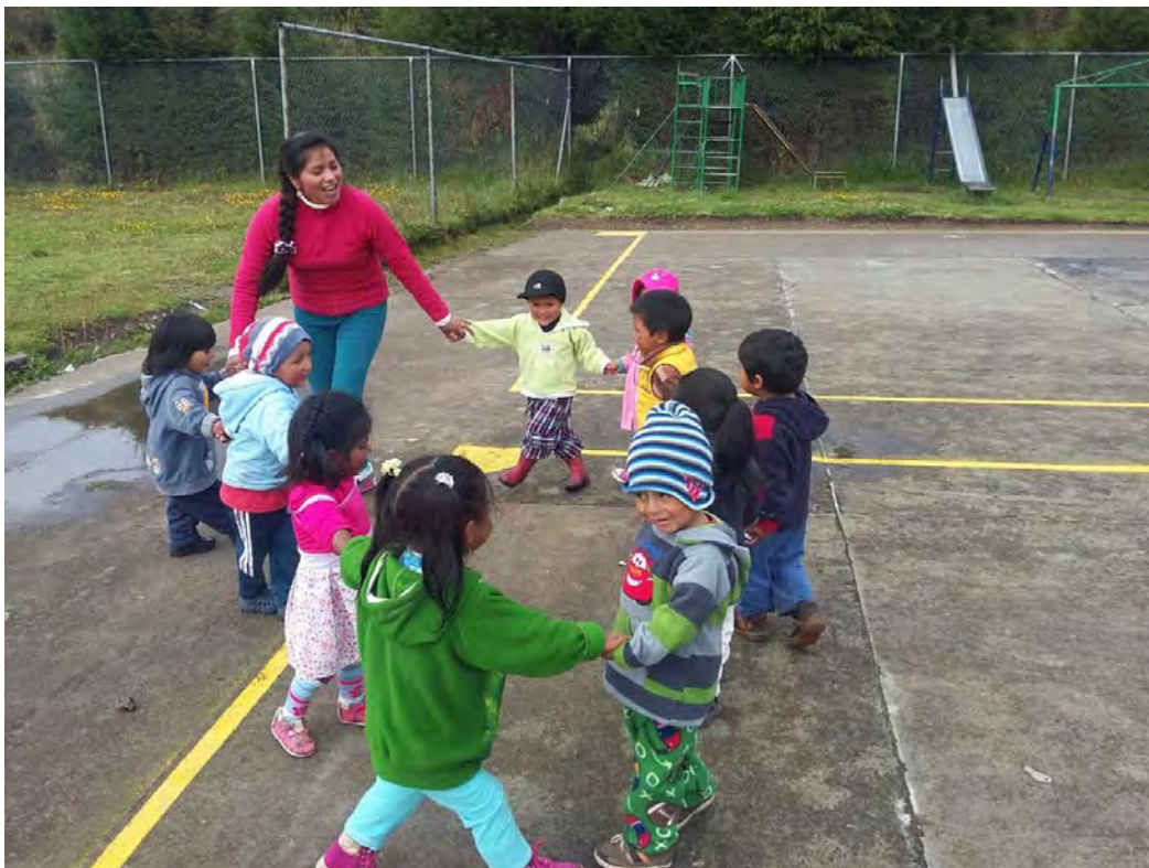
Niños y niñas del CIBV Kuri Muyo desarrollando vocabulario a través de la canción el Patio de mi Casa