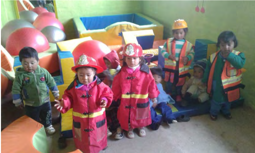
Niños y niñas del CIBV de Cananville trabajan en motricidad gruesa y refuerzo de oficios