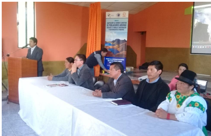
F1: Mesa Directiva: Alcalde y Autoridades Parroquiales

Para ese objetivo, reitera que no se compromete en el momento, pero se valorará la propuesta, invitando a las reuniones que sean necesarias.