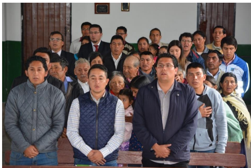
F2: Una parte de la ciudadanía y funcionarios/os públicos de las entidades participantes en el Evento de Rendición de Cuentas