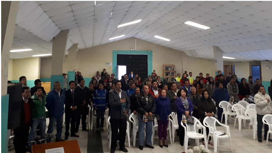
F2: Inicio del Evento de Rendición de Cuentas, con el Himno Nacional del Ecuador