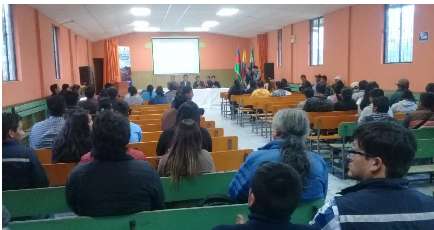
F2: Participantes en la Asamblea de Rendición de Cuentas