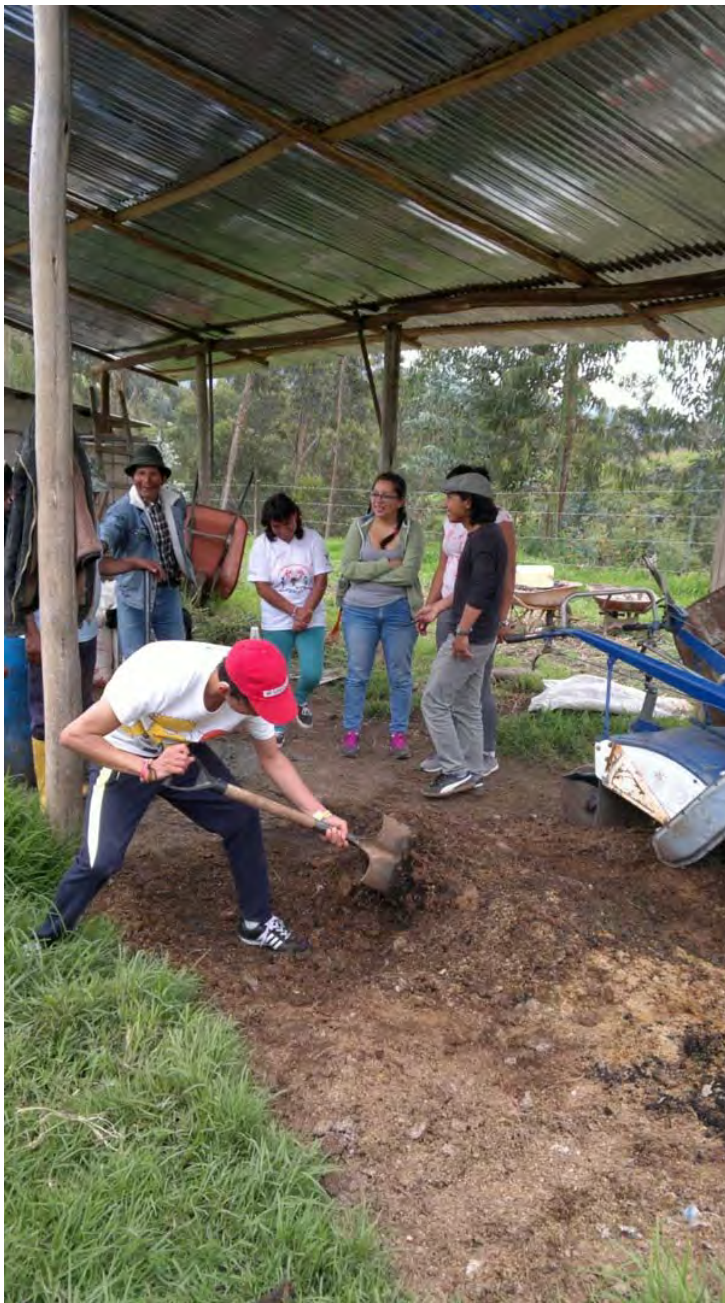
TALLER AGRÍCOLA EN COMUNIDAD DE PURUHUANTAG