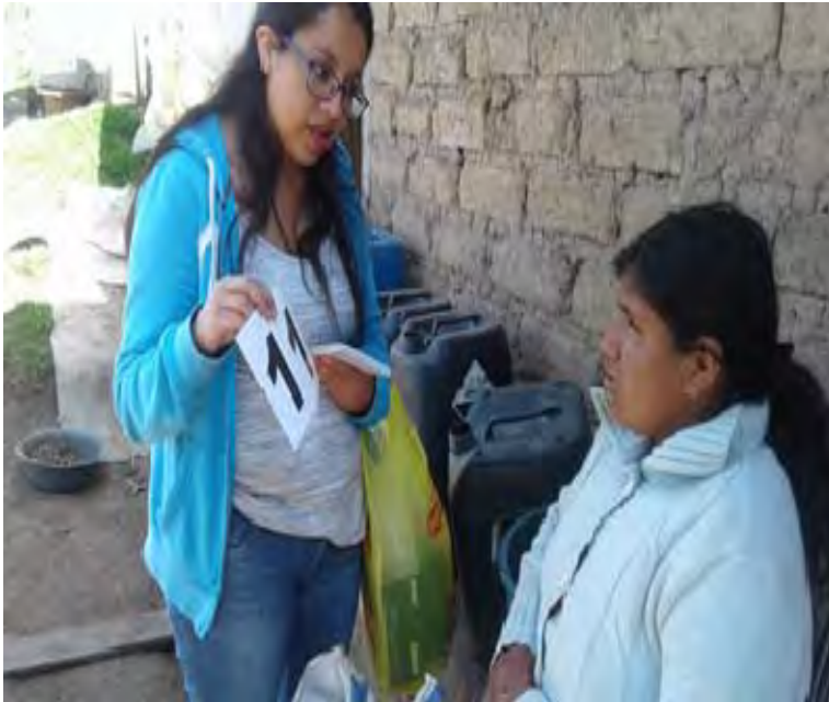
Identificación de números del 10 al 20, mediante bits numéricos.