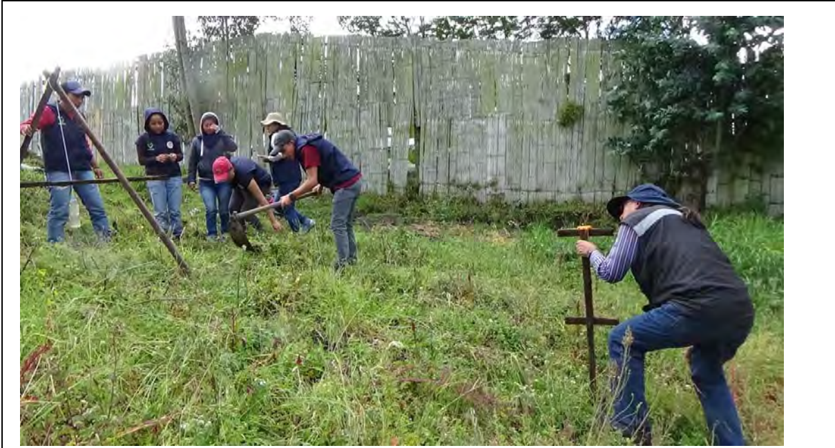
Estudiantes Facultad de Agronomía UCE- Seguimiento a productores en Tocachi