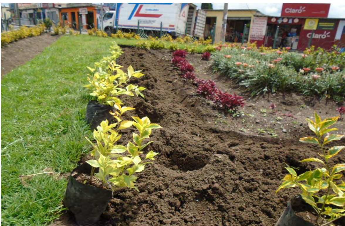
Fotografía N° 8: plantas introducidas en el parque de La Y de Tabacundo.