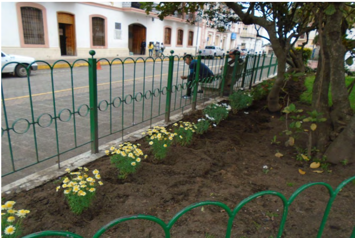
Fotografía N° 4: siembra de plantas en el parque central Tabacundo.