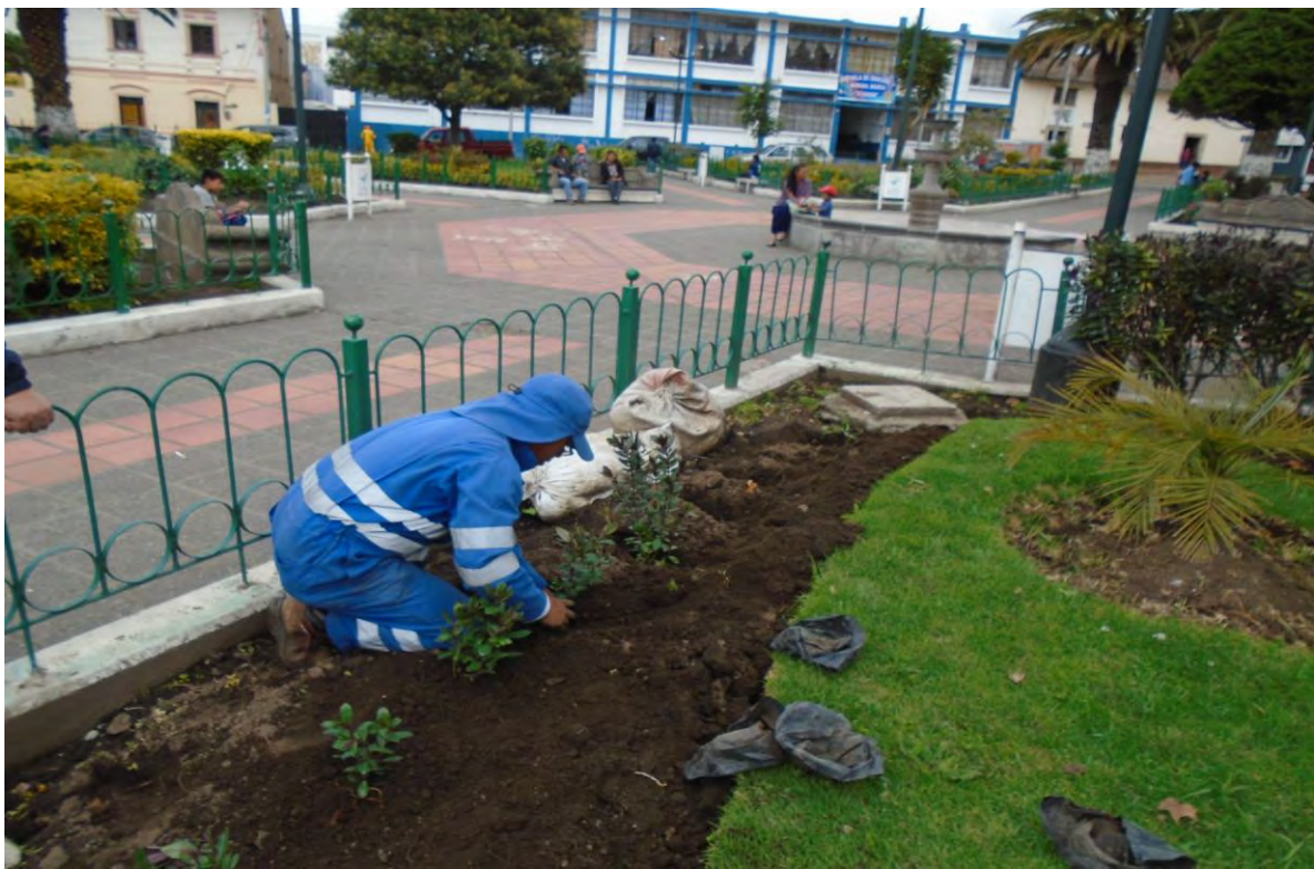
Fotografía N° 6: siembra de plantas en el parque central de Tabacundo.