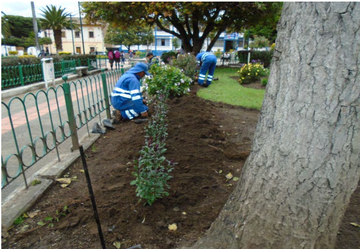
Fotografía N°3: siembra de plantas en el parque central de Tabacundo.