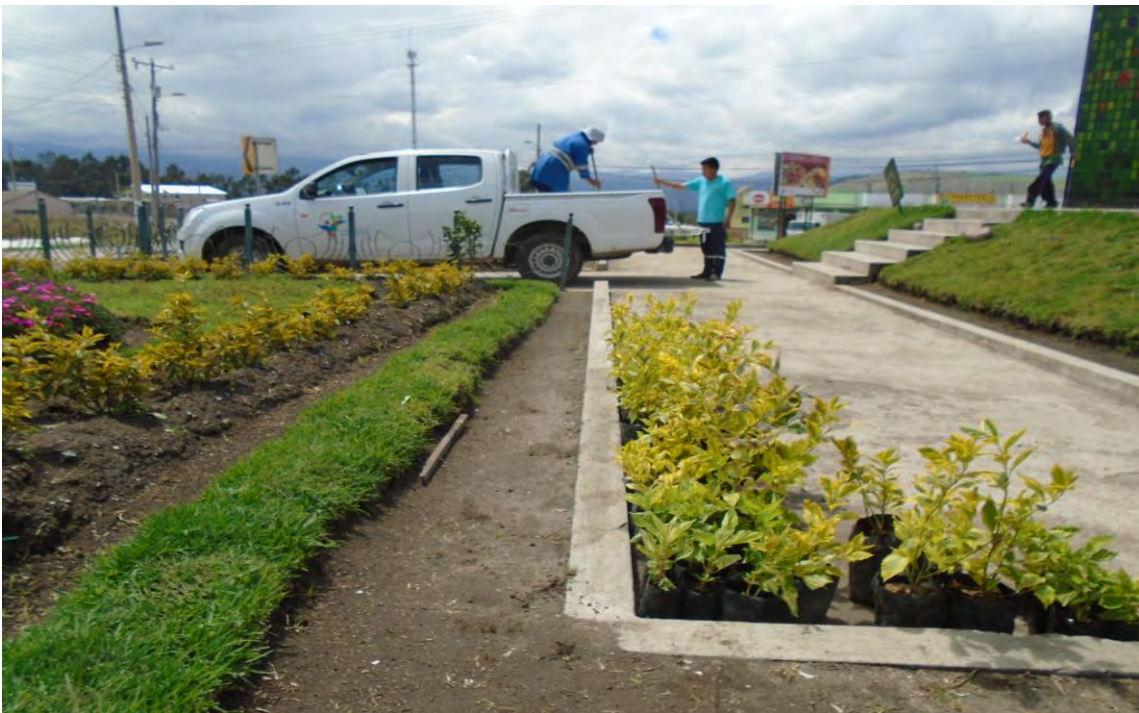
Fotografía N° 2: transporte de plantas al parque de La Y de Tabacundo.