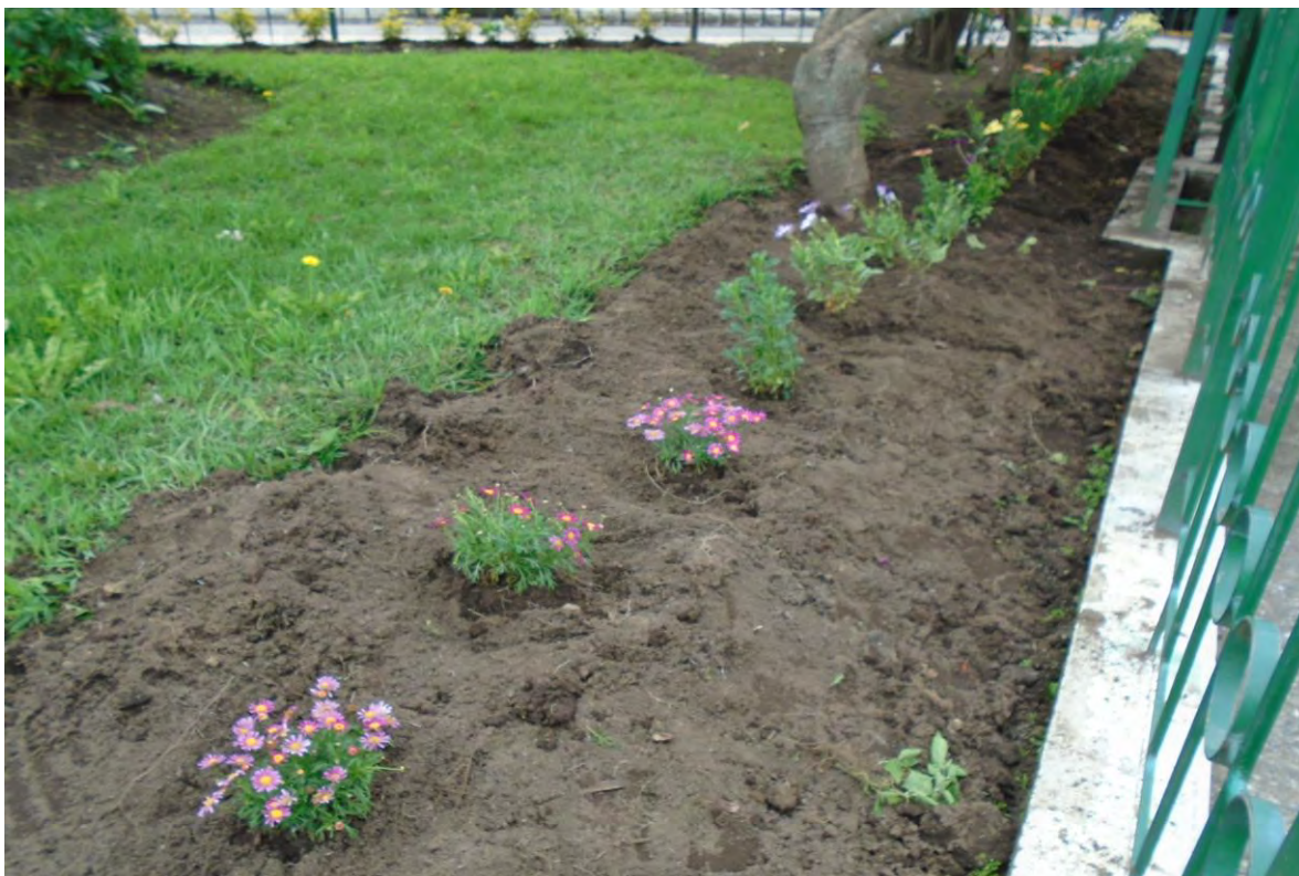
Fotografía N° 7: siembra de plantas en el parque central de Tabacundo.