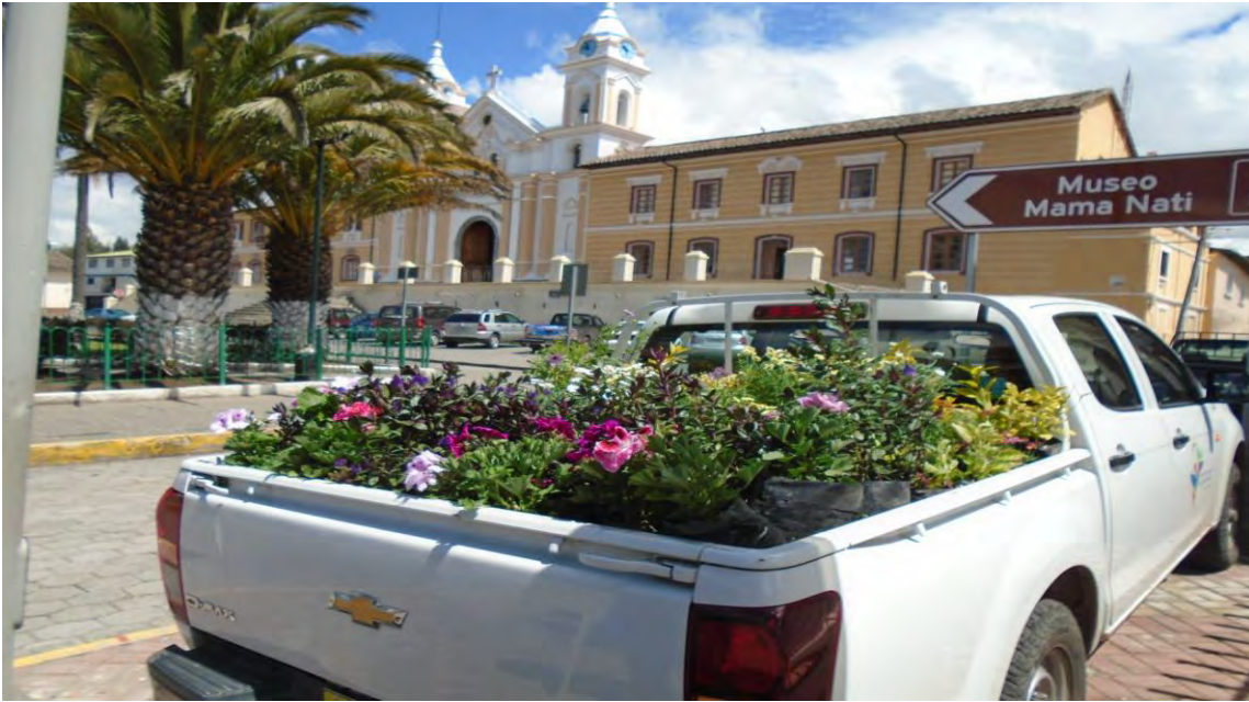
Fotografía N° 1: transporte de plantas ornamentales al parque central de Tabacundo.

Mejoramiento de la imagen paisajística del parque central Tabacundo y parque La Y de Tabacundo, mediante el cambio de las plantas viejas o destruidas por plantas nuevas.