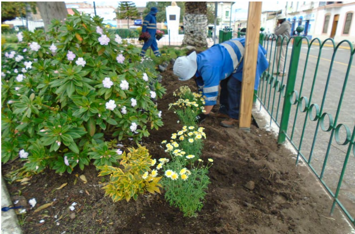
Fotografía N° 5: siembra de plantas en el parque central de Tabacundo.