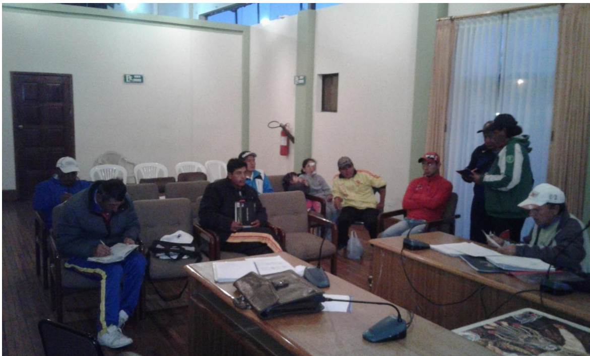
ORGANIZACIÓN DE LAS SEMIFINALES Y FINALES DEL CAMPEONATO BICANTONAL DE ESCUELAS DE FÚTBOL.