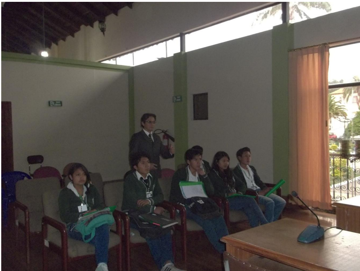
JÓVENES DE LA UNIDAD EDUCATIVA TABACUNDO, ASPIRANTES A LA RAMA AGROECOLÓGICA.