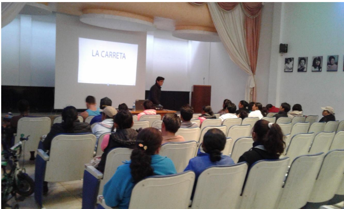
TALLER DE MOTIVACIÓN ESCUELA DE FÚTBOL LA ESPERANZA.