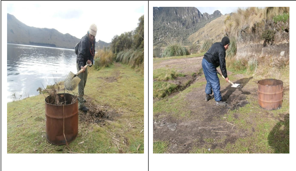
• ARREGLO Y MANTENIMIENTO DE PASES DE AGUA EN LA ZONA LACUSTRE MOJANDA