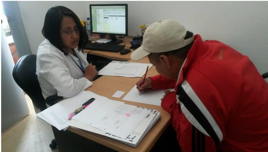
Atención Médica para Evaluación Psicológica y Control de Medicación en Hospital Psiquiátrico "Julio Endara"