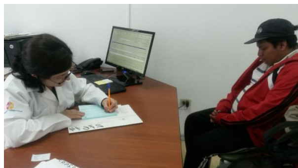
Atención Psicológica Hospital Pablo Arturo Suárez Ciudad de Quito