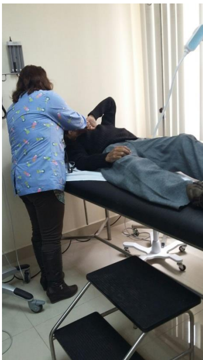
Atención Médica MSP